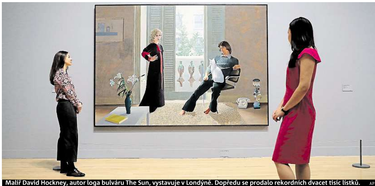
Malíř David Hockney, autor loga bulváru The Sun, vystavuje v Londýně. Dopředu se prodalo rekordních dvacet tisíc lístků.

Tabu. Banky přestaly poskytovat stoprocentní hypotéky v říjnu. Lze to obejít. Finanční poradce i tak dokáže sehnat celou sumu. Pozor na rizika. Na sto procent se dostanete dalším úvěrem či ručením nemovitostí STRANA 2