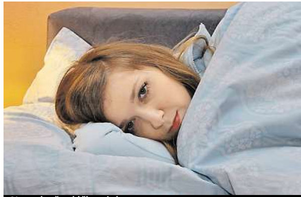
Nepodceňte léčbu virózy.

Nejohroženější skupinou jsou děti v prvních třech letech života, jejichž organismus musí s virovou infekcí bojovat víckrát za rok. I když se zdá, že je nemocí konec, kašel často přetrvává minimálně tři týdny. Výjimkou není ani osmítýdenní trápení. Není proto divu, že se rodiče začínají hroutit při každém dětském zakašlání. „Občasné pokašlávání je v pořádku. Zbystřit bychom měli, pokud se stav po pár dnech nelepší, či je dokonce horší nebo se