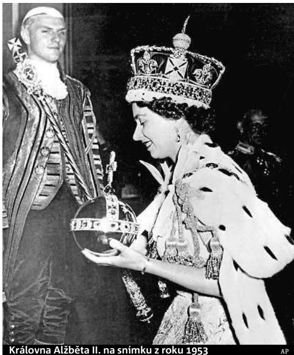
Královna Alžběta II. na snímku z roku 1953

Alžběta II. je nyní nejstarším vládnoucím monarchou na světě. Během její vlády se ve funkci vystřídalo třináct britských premiérů počínaje Winstonem Churchillem