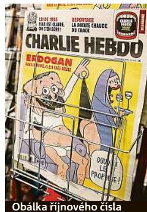
Obálka říjnového čísla

„Charb“ byla přezdívka Stéphane Charbonniera, karikaturisty a šéfredaktora časopisu. Když ho teroristé našli, vystřelili jeho směrem sedm ran. Nepřežilo dalších devět členů redakce, deset zranili.