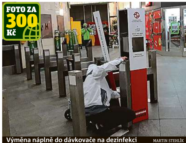
Výměna náplně do dávkovače na dezinfekci

Podle šéfa komunikace dopravního podniku Daniela Ša-