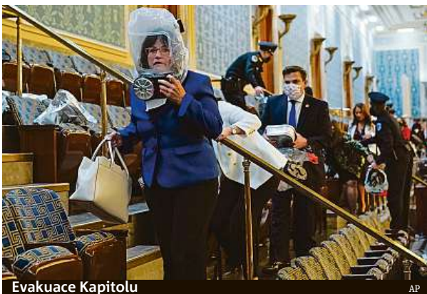
Evakuace Kapitolu AP

Dav se následně přesunul před budovu Kongresu, kde začalo jednání k oficiálnímu potvrzení vítězství Trumpova soupeře, demokrata Joea Bidena. Někteří demonstranti se začali dobývat také do budovy a obě komory Kongresu, které v tu chvíli separátně projednávaly námítky republikánů ke sčítání hlasů v Arizoně, přerušily jednání. Ochránka následně členům