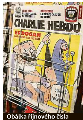
Obálka říjnového čísla

„Charb“ byla přezdívka Stéphane Charbonniera, karikaturisty a šéfredaktora časopisu. Když ho teroristé našli, vystřelili jeho směrem sedm ran. Nepřežilo dalších devět členů redakce, deset zranili.