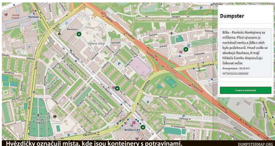
Hvězdičky označují místa, kde jsou kontejnery s potravinami.

S trochu jiným konceptem přišla i další facebooková skupina – Dumpster, freegan PRAHA. Kromě jídla zde lidé