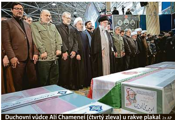
Duchovní vůdce Alí Chameneí (čtvrtý zleva) u rakve plakal

Íránský nejvyšší duchovní ajatolláh Alí Chameneí se modlil nad rakvami velitele Solejmáního a dalších, které v pátek u letiště v Bagdádu zabily rakety Spojených států. Podle agentury AP v jednu chvíli duchovní, který měl k zabitému generálovi blízko, plakal. Po boku nejvyššího duchovního stáli také prezident Hasan Rúhání, nový velitel jednotek Kuds Esmáíl Káání a další vysoce postavení představitelé islámské republiky.