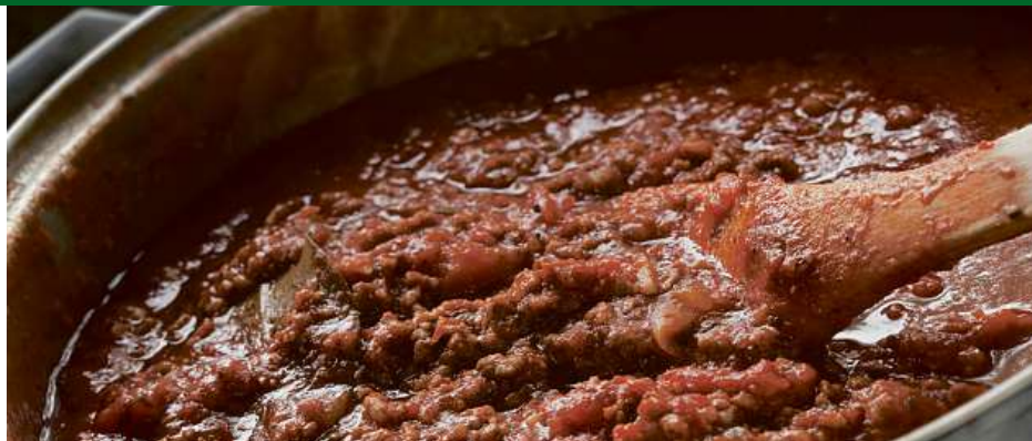
Cooking makes chemical changes

What type of scientist were Marie Curie, Robert Boyle and Alfred Nobel?