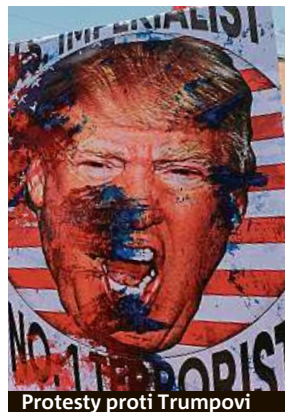
Protesty proti Trumpovi

Německá kancléřka Angela Merkelová, francouzský prezident Emmanuel Macron a britský premiér Boris Johnson vyzvali ve společném prohlášení ke zmírnění napjaté situace v Iráku. Spirála násilí a útoky na koaliční síly podle nich musí skončit. Zvláště Írán musí upustit od dalších násilných akcí, uvedli. Šéf diplomacie Evropské unie Josep Borrell vyjádřil politování nad nedělními výroky íránských představitelů, kteří avizovali, že Teherán bude dál vypovídat jadernou dohodu z roku 2015. „Odsoudili jsme nejnovější útoky na koaliční jednotky a jsme hluboce zne-