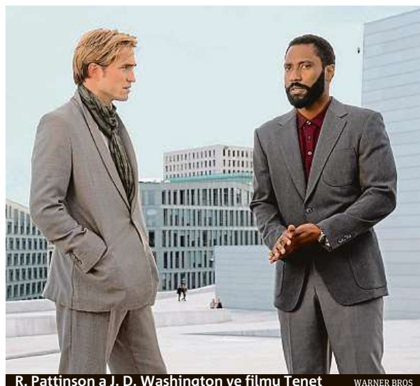
R. Pattinson a J. D. Washington ve filmu Tenet