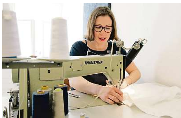
K. Bana pořádá také kurzy šití.