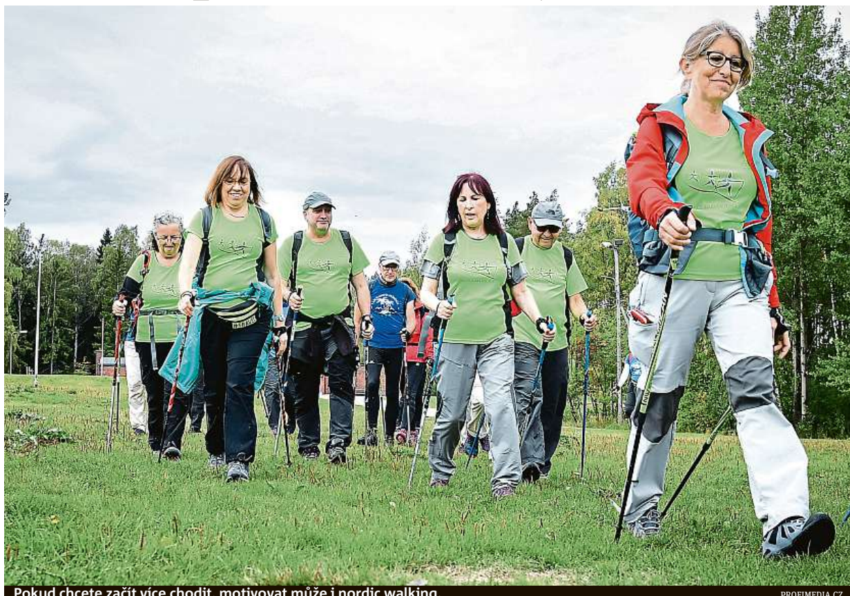
Pokud chcete začít více chodit, motivovat může i nordic walking.

V jídlu omezte živočišné tuky a zařadte více ryb. Naučte se několikrát denně jíst ze-