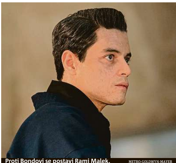
Proti Bondovi se postaví Rami Malek.