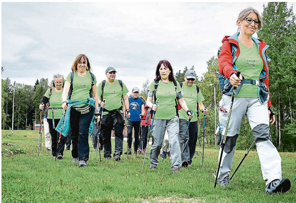
Pokud chcete začít více chodit, motivovat může i nordic walking.

V jídlu omezte živočišné tuky a zařadte více ryb. Naučte se několikrát denně jíst ze-