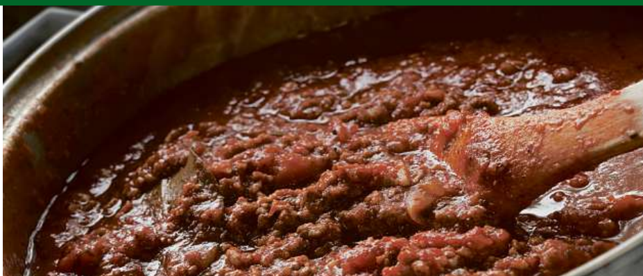
Cooking makes chemical changes

What type of scientist were Marie Curie, Robert Boyle and Alfred Nobel?