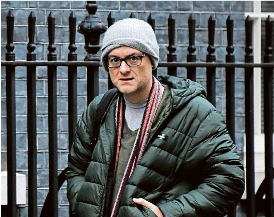
Dominic Cummings přichází k sídlu britského premiéra v Downing Street.

Ve službách britského státu podle Cummingsa pracuje mnoho skvělých lidí. „Existují ale také hluboké problémy v jádru toho, jak činí britský stát svá rozhodnutí,“ uvedl muž, který je považován za hlavního Johnsonova brexitového стратега a architekta