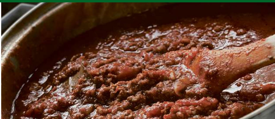
Cooking makes chemical changes

What type of scientist were Marie Curie, Robert Boyle and Alfred Nobel?