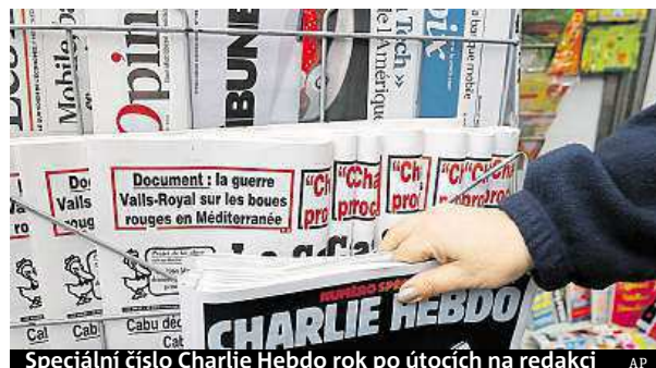
Speciální číslo Charlie Hebdo rok po útocích na redakci

Satirický časopis Charlie Hebdo rok po útocích na redakci vydal speciální číslo.