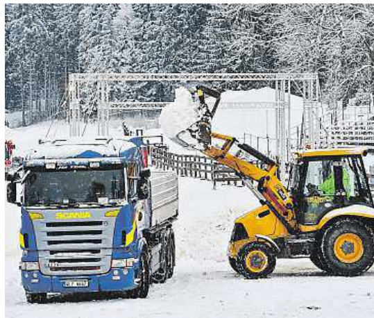
Příprava tratě na víkendový program jede na plné obrátky.