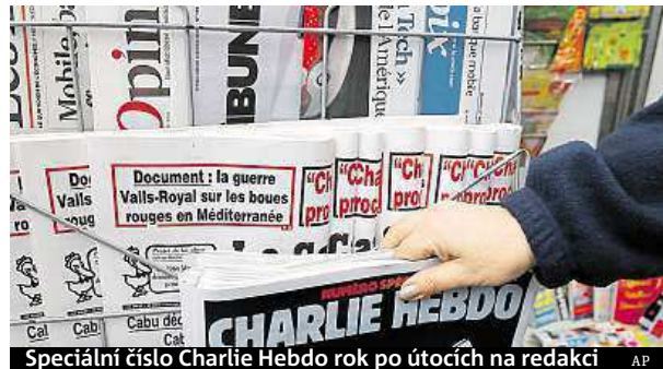
Speciální číslo Charlie Hebdo rok po útocích na redakci

Satirický časopis Charlie Hebdo rok po útocích na redakci vydal speciální číslo.