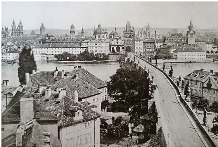
Nejstarší dochovaný snímek Prahy. Pochází z roku 1856. Více snímků metropole z první éry fotografie najdete i v kalendáři Miluju Prahu pro rok 2024. ANDREAS GROLL