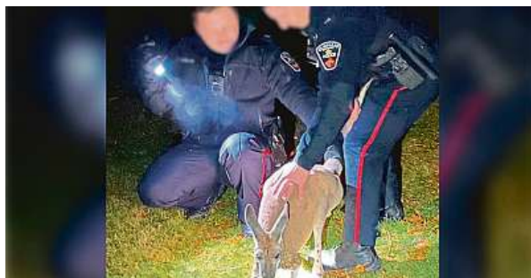
Klokan byl odchyten podle pokynů, pak se ale ohnal.