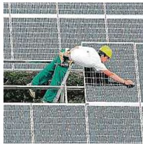
Kdo má solární panely, mohl by příští rok ještě více ušetřit.