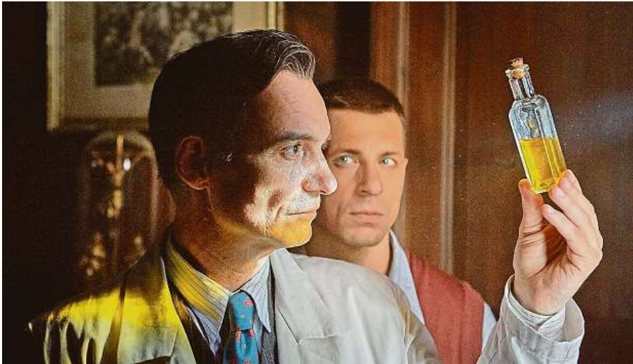
Soud v červenci rozhodl, že musí provozovatel Ulož.to distributorovi filmů Cinemart zaplatit 976 tisíc korun. Umožňoval totiž bez licence stahovat snímek Šarlatán režisérky Agnieszky Hollandové.

agentur držících autorská práva k různým audiovizuálním dílům. V letošním roce kupříkladu jedna z žalob doputovala až k ústavnímu soudu, který rozhodl v neprospěch Ulož.to. Potvrdil tím dřívější verdikty, podle kterých server musí znemožnit stahování pirátských kopií filmů Pelíšky, Ostře sledované vlaky, S čerty nejsou žerty, Vesničko má středisková, Kobry a užovky a Obušku, z pytle ven.