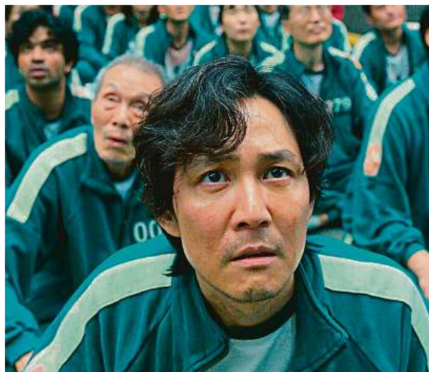
Streamovací platformy dávno změnilý způsob, jakým lidé vnímají