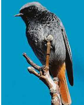
Rehek domácí. Můžete ho vidět ve městech i v odlehlých místech.

Rehek domácí. Ornitologové zjišťují, že na zimu už neodlétá.