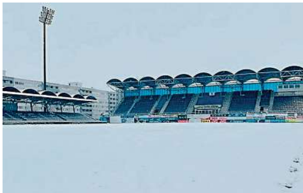
Takhle zasněžený byl stadion Mladé Boleslavi o víkendu, nemohl se odehrát duel s Karvinou, proti Plzni by domácí nastoupit měli.

Duel Mladé Boleslavi s Plzní se v původním srpnovém termínu neodehrál kvůli účasti Viktorie v závěrečném 4. předkole Evropské konferenční ligy. Oba týmy budou mít po vzájemném utkání nadále jeden duel k dobru, jelikož ve víkendovém 17. kole nenastoupily. Mladá Boleslav