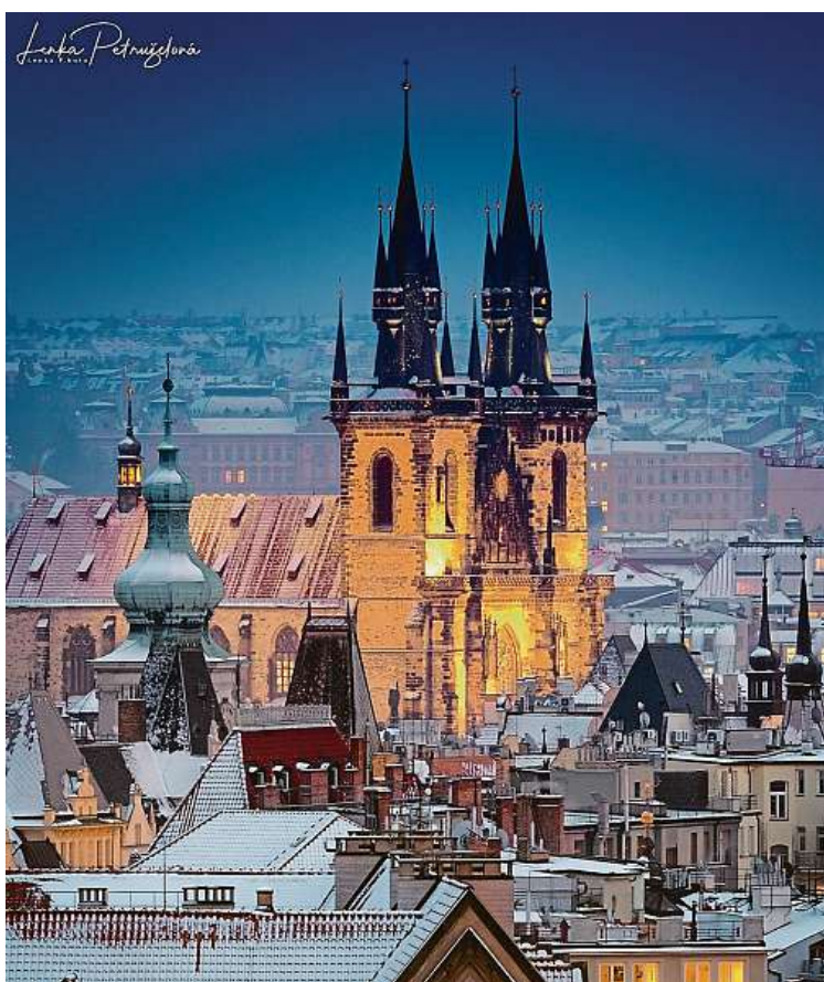
Pokochat se snímky od Lenky Petruželové můžete i na Instagramu. @LENKA_PETRUZELOVA