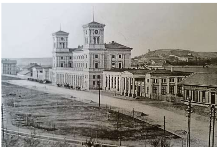
Původní podoba nádraží císaře Františka Josefa I. (nyní hlavní nádraží) v roce 1871. Snímek pořídil jeden z pionýrů české fotografie. FRANTIŠEK FRIDRICH