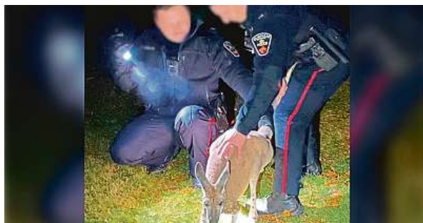
Klokan byl odchyten podle pokynů, pak se ale ohnal.