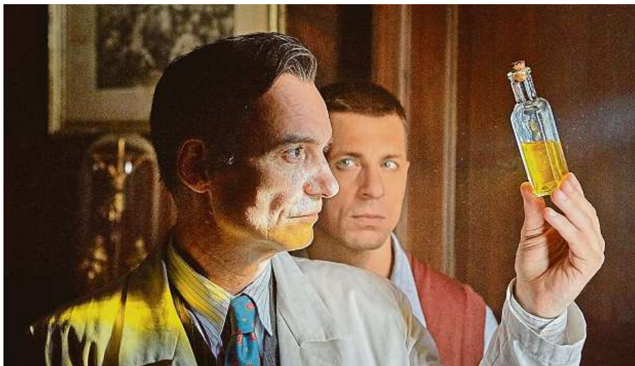
Soud v červenci rozhodl, že musí provozovatel Ulož.to distributorovi filmů Cinemart zaplatit 976 tisíc korun. Umožňoval totiž bez licence stahovat snímek Šarlatán režisérky Agnieszky Hollandové.

agentur držících autorská práva k různým audiovizuálním dílům. V letošním roce kupříkladu jedna z žalob doputovala až k ústavnímu soudu, který rozhodl v neprospěch Ulož.to. Potvrdil tím dřívější verdikty, podle kterých server musí znemožnit stahování pirátských kopií filmů Pelíšky, Ostře sledované vlaky, S čerty nejsou žerty, Vesničko má středisková, Kobry a užovky a Obušku, z pytle ven.