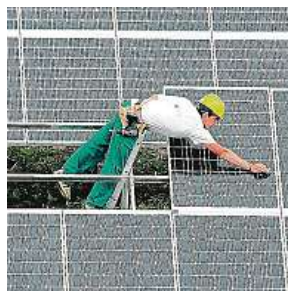
Kdo má solární panely, mohl by příští rok ještě více ušetřit.