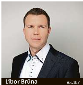
Libor Brůna ARCHIV

Ano, spoření do zlata je velkým trendem poslední doby. Jeho výhodou je průměrování ceny. Člověk díky tomu třeba získá větší a cenově výhodnější slitky, nejčastěji o váze jedné trojské unce (31,1 gramu – pozn. redakce). Jako dárek jsou nejoblíbenější stříbrné mince v hodnotě od 500 do dvou tisíc korun od renomovaných světových mincoven. Hodnota takových předmětů