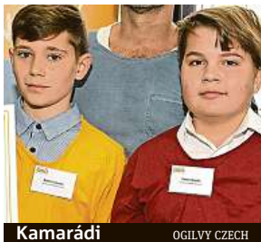
Kamarádi OGIUVY CZECH

Za skutky odvahy, soucitu a všímavosti vůči okolí získali ocenění v projektu Dětský čin roku.