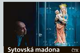
Sytovská madona ČTK

Muzeum v Semilech bude vystavovat takzvanou Sytovskou madonu. Vzácná gotická plastika z lipového dřeva pochází z přelomu 14. a 15. století. Muzeu ji zapůjčilo Litoměřické biskupství na dobu pěti let. ČTK