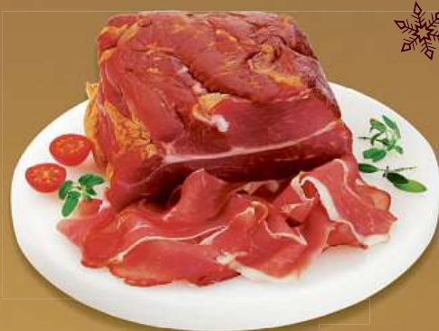
Schinkenspeck z pultu lahůdek cena za 100 g