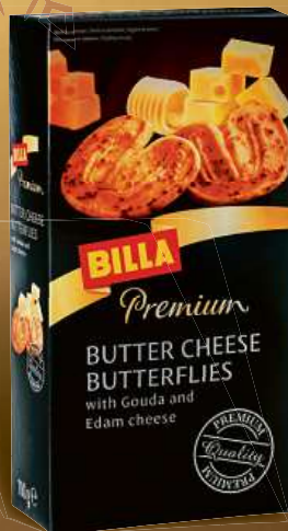
BILLA Premium Máslovo-sýrové krekry 100 g