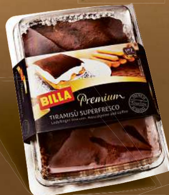
BILLA Premium Tiramisu 300 g