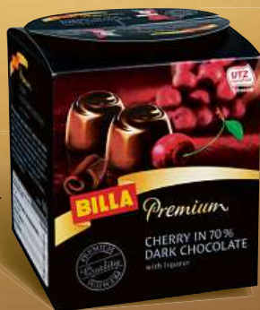
BILLA Premium Cherry in 70% dark chocolate 168 g