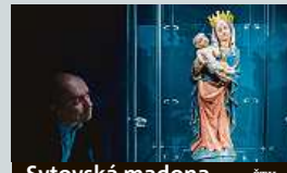
Sytovská madona ČTK

Muzeum v Semilech bude vystavovat takzvanou Sytovskou madonu. Vzácná gotická plastika z lipového dřeva pochází z přelomu 14. a 15. století. Muzeu ji zapůjčilo Litoměřické biskupství na dobu pěti let. ČTK