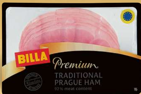
BILLA Premium Tradiční Pražská šunka 150 g