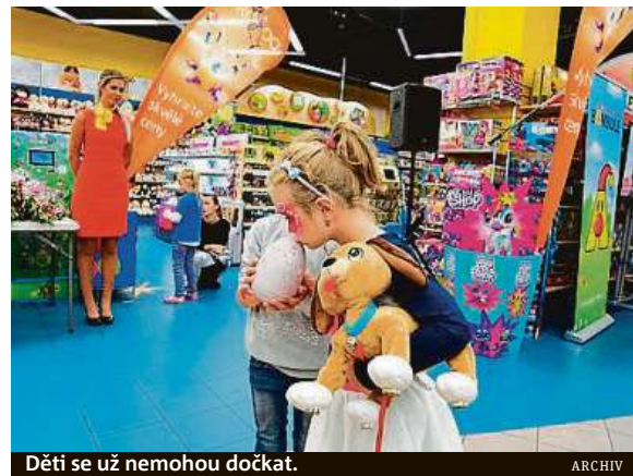
Děti se už nemohou dočkat.

Co je u rodičů a jejich dětí zcela odlišné, je doba, po které je určitá hračka dokázala zabavit. Třetinu rodičů bavily hračky průměrně dva roky a více (30 procent), menší část rok až dva (27 procent) nebo půl roku (17 procent). Svě děti považují za daleko náročnější, hračka je podle nich nejčastěji zabaví na měsíc (31 procent), čtvrt roku (21 procent) a půl roku (17 procent). Rok až dva baví jednu hračku také 17 procent dětí, dva a více let jen 13 procent dětí. MET