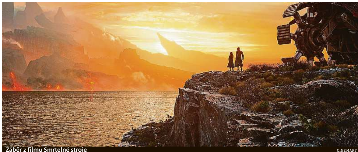
Záběr z filmu Smrtné stroje

Tímhle způsobem se v Londýně ocitne i Hester Shaw (Hera Hilmar), tajemná dívka se zjizvenou tváří. Jí jedině, zdá se, nevadí, že Londýn