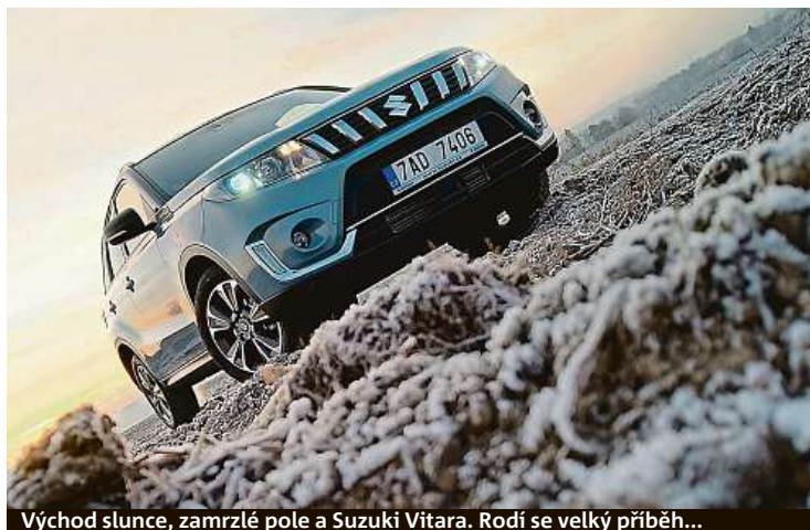
Východ slunce, zamrzlé pole a Suzuki Vitara. Rodí se velký příběh...