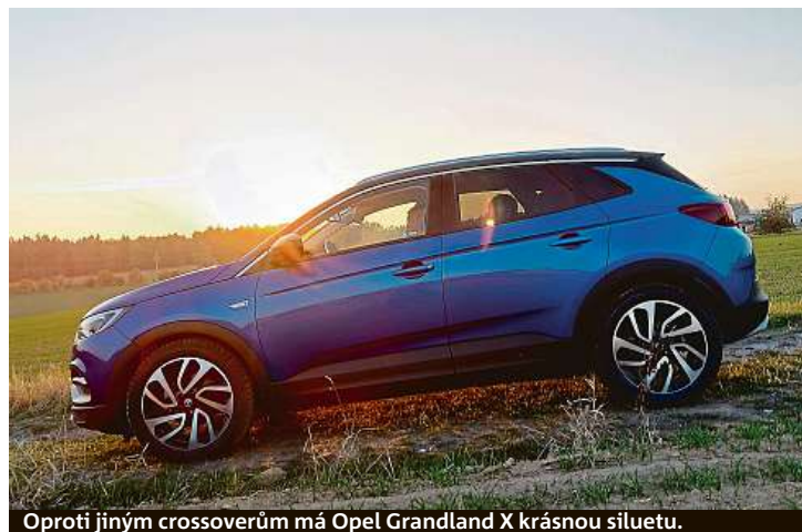
Oproti jiným crossoverům má Opel Grandland X krásnou siluetu.

Legendární Vitara je na světě už 30 let. Nyní přijíždí v omlazené verzi.