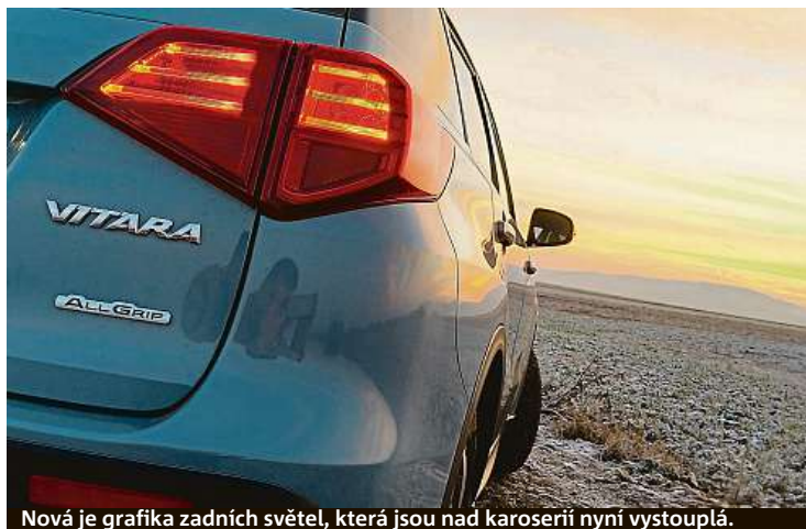
Nová je grafika zadních světel, která jsou nad karoserií nyní vystouplá.

I ve velkém SUV od Opelu je technika francouzská, sdílí ji s Peugeotem 3008. Ten nenabízí pohon všech kol, takže ho nemá ani Grandland X. Je to škoda, za ty ceny bychom si čtyřkolku užili. Pochvalu ale vnitřnosti auta zaslouží. Převodovka fungovala bezchybně a u motoru potěšila i vzhledem k jeho obsahu spotřeba kolem sedmi litrů. Byl příkladně odhlučněn, ale ruku na srdce – mohl by být živější. PETR HOLEČEK