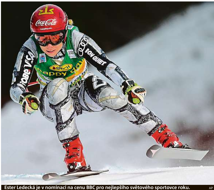
Ester Ledecká je v nominaci na cenu BBC pro nejlepšího světového sportovce roku. AP

Od neděle už bude jezdit na snowboardu, aby byla připravena na start SP v Carezze 13. prosince. O dva dny později ji čeká další závod v Cortině d'Ampezzo. „Bude makačka se pak přehodit na snowboard, ale doufám, že všechno zvládneme tak, jak si naplánujeme,“ řekla Ledecká, která loni úvodní dva závody SP vyhrála. ČTK