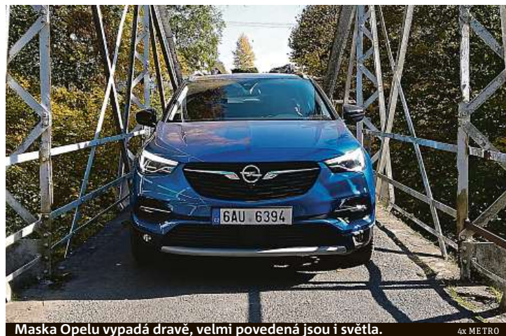
Maska Opelu vypadá dravě, velmi povedená jsou i světla.