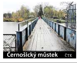
Černošický můstek