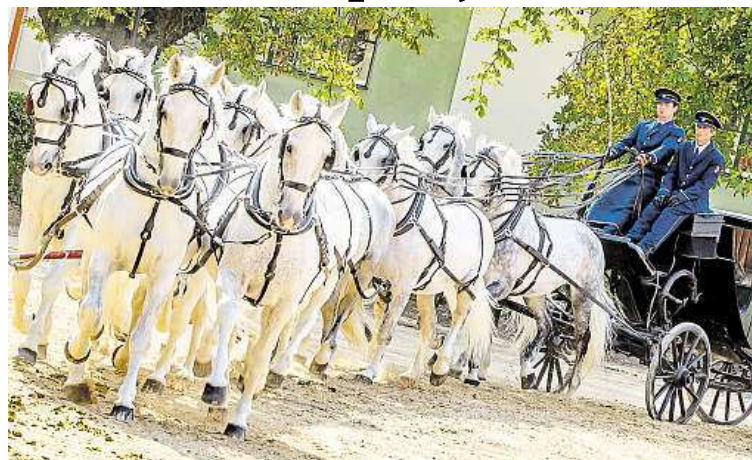
Kladrubáci chtějí být v prestižní společnosti.

Česko má v současnosti na prestižním seznamu světového kulturního a přírodního dědictví UNESCO dvanáct památek. Od zápisu prvních z nich, historických center Prahy, Českého Krumlova a Telče, uplyne příští týden ve čtvrtek už 25 let.