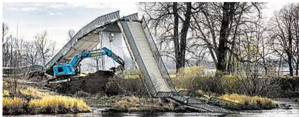
Lávka se zřítila v sobotu. Bagry mají v Troji napilno.

Náklady na odstranění trosk mají Prahu vyjít na deset milionů korun.