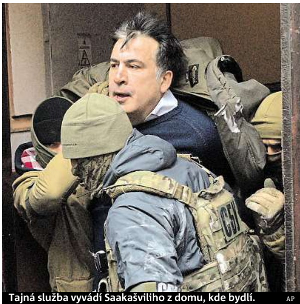
Tajná služba vyvádí Saakašviliho z domu, kde bydlí.

Tajná služba ráno v kyjevském bytě gruzínského politika zahájila razii. Vyšetřování se má týkat financování protivládních mítinků, které politik na Ukrajině organizoval. Politik během razie vylezl na střechu domu a vyhrožoval, že z ní skočí. Bezpečnostní složky ho ze střechy sundaly. Na podporu se před domem sešlo několik stovek jeho stoupenců, kteří se následně střetli s příslušníky bezpeč-