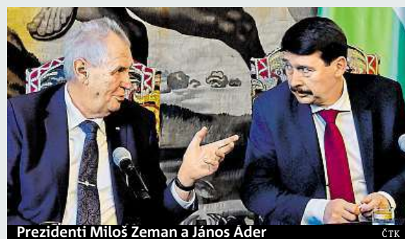
Prezidenti Miloš Zeman a János Áder