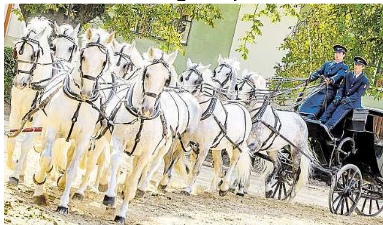
Kladrubáci chtějí být v prestižní společnosti.

Česko má v současnosti na prestižním seznamu světového kulturního a přírodního dědictví UNESCO dvanáct památek. Od zápisu prvních z nich, historických center Prahy, Českého Krumlova a Telče, uplyne příští týden ve čtvrtek už 25 let.