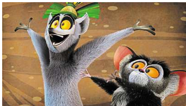
Na párty vlnu naladí král Jelimán.