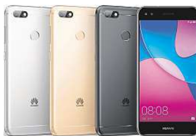
Mobilní telefon Huawei P9 Lite Mini

Telefon klade důraz na celkovou ergonomii, aby se dobře držel v ruce a dal se pohodlně ovládat i jednou rukou. Kromě menších rozměrů tomu nahrává také zaoble-