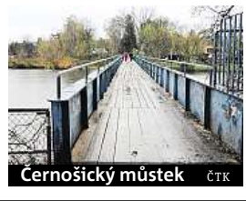
Černošický můstek