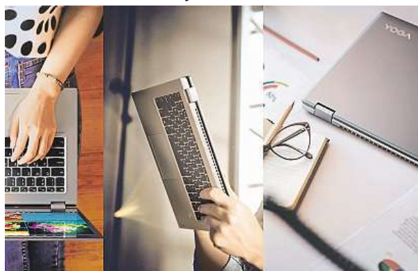
Notebook Lenovo Yoga 520-14IKB

Notebook Lenovo Yoga 520-14IKB pořídíte například v největším českém IT e-shopu Mironet, a to za velmi atraktivní cenu 17 997 korun.