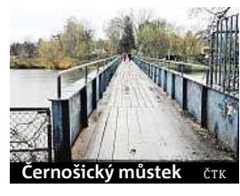
Černošický můstek