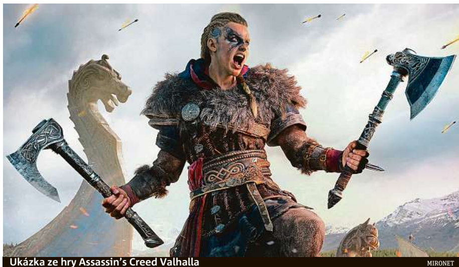
Ukázka ze hry Assassin's Creed Valhalla

Vikingská tematika byla pro většinu z nás donedávna spjata hlavně s filmy a seriály. Díky novému dílu hry s názvem Assassin's Creed Valhalla si však budete moci zažít,