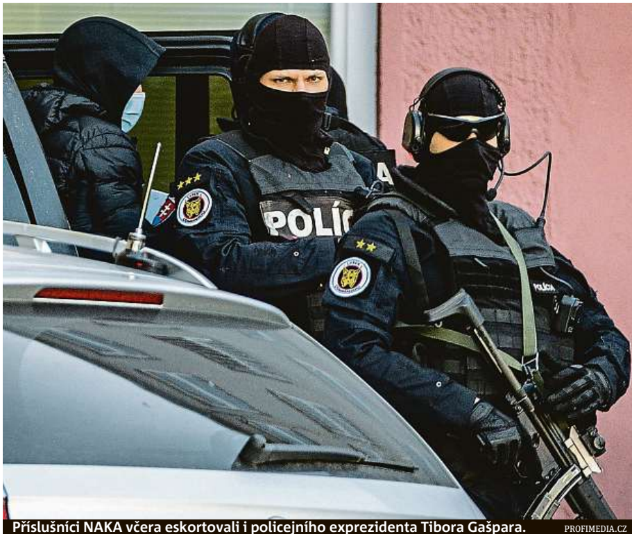
Příslušníci NAKA včera eskortovali i policejního exprezidenta Tibora Gašpara.