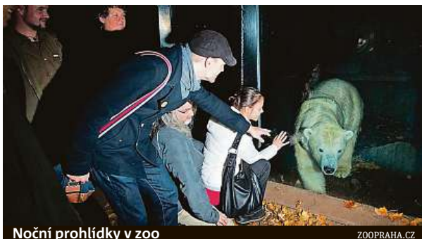
Noční prohlídky v zoo

Fanoušci hudby mohou vyrazit hned na několik velkých koncertů, které se v Praze v podzimních dnech konají. Svě nové album SÍ přijede 30. listopadu do O2 areny představí tenor Andrea Bocelli. Jako jedna z největších světových klasických hvězd prodal 80 milionů nosičů, zpíval pro papeže, prezidenty, královskou rodinu a během svého celosvětového turné zamířil počtvrté i do České republiky. Bocelliho snad neznámější píseň Time To Say Goodbye se dočkala nové verze, nazpíval ji společně se sopranistkou Sarah Brightmanovou. Tato hvězdná zpěvačka s jedinečným hlasem, jenž dokonale stírá hranice mezi