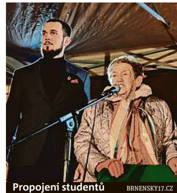
Propojení studentů BRNĚNSKY17.CZ

Akce Brněnský sedmnáctý začne ve 13 hodin na náměstí Svobody. Lampionový průvod je zde naplánován na 17.17. Více o bohatém programu akce najdete na www.brnensky17.cz .