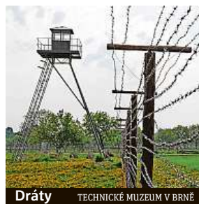
Dráty TECHNICKÉ MUZEUM V BRNĚ

Už od září běží v kině Scala cyklus Kino pravdy a lásky. Ten 12. listopadu v předpremiéře uvede film Amnestie. Thriller o svobodě, inspirovaný knihou Radovana Dunaje, otevírá téma amnestie Václava Havla, která byla jedním z prvních kroků, pro něž se po zvolení do prezidentské funkce rozhodl, a která je dosud kontroverzně přijímaná. Věznic a vazby tehdy opustilo zhruba 23 000 osob. Idea druhé šance, která ovšem nezahrnovala všechny odsouzené, rozpoutala vzpuru ve věznicích Leopoldov. Ta v konečné fázi vyústila v ozbrojený konflikt s československou bezpečnostní složkou.