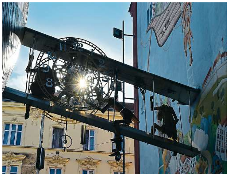
Divadlo provozuje i vlastní muzeum loutek.