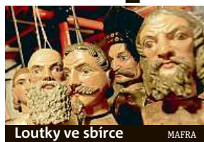
Loutky ve sbírce

„Samo proscénium představuje exkluzivní objekt. Má neobvykle velký rozměr a je ma-