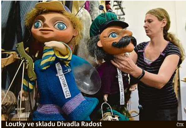
Loutky ve skladu Divadla Radost

„Děti vždycky potřebují, aby tam byl humor, to je zájme, stejně jako silný příběh. A strašně rády se bojí. Strach o hrdiny je vynikající záležitost,“ řekl ředitel divadla Vlastimil Peška. Dětský divák se podle něj nijak zásadně nemění, byť současné děti oproti předchozím generacím žádají trochu více akce na jevišti. U dětských diváků slaví úspěchy už 70 let. V čele Radosti je pětadesátiletý Peška od roku 1994. Během