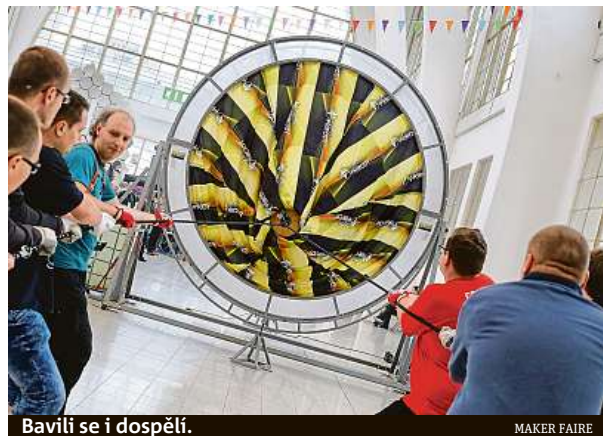
Bavili se i dospělí.