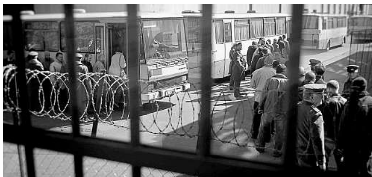
Snímek z filmu Amnestie