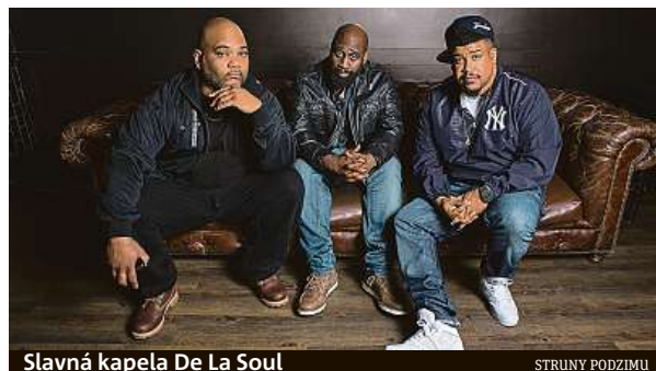
Slavná kapela De La Soul

Pro všechny, kdo rádi objevují nové hudební inspirace, je určen festival Nouvelle Prague, který ve formátu minikoncertů představí od 7. do 9. listopadu v DOX + a Cross Clubu přes dvě desítky mladých interpretů z Česka i celé Evropy.