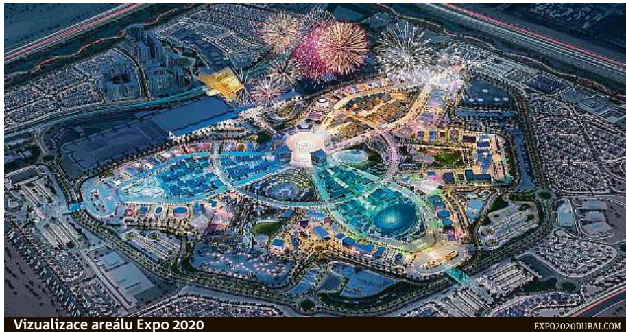
Vizualizace areálu Expo 2020

Brněnští radní vybrali nejlepší ideový koncept společné prezentace, kterou předložilo architektonické studio Chybič+Kristof Associated Architects. Expozice je v jeho podání koncipována jako interaktivní prostor, který vtáhne návštěvníka svojí atmosférou umocněnou světelnými a zvukovými efekty. Návštěv-