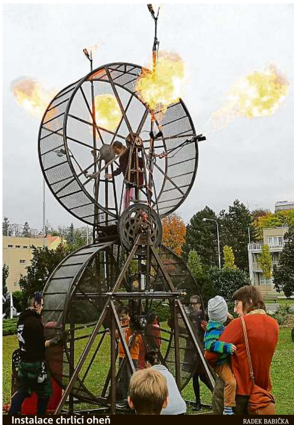
Instalace chrlící oheň

„Lidé se nás často ptali, co bude dál. Kam mohou přijít tvořit, až festival skončí. Proto se snažíme vést dialog i s veřejnou správou a místními firmami a hledat cesty k zakládání otevřených dílen fungujících celoročně,“ říká Kolařík. RADEK BABIČKA