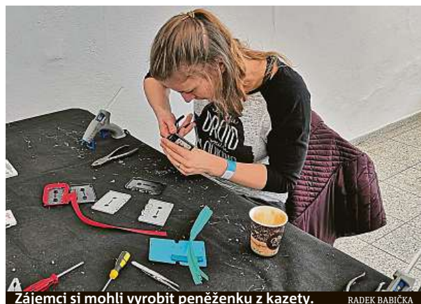
Zájemci si mohli vyrobit peněženku z kazety.