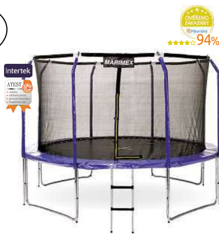
Trampolína Marimex 366 cm schůdky a vnitřní ochranná síť ZDARMA