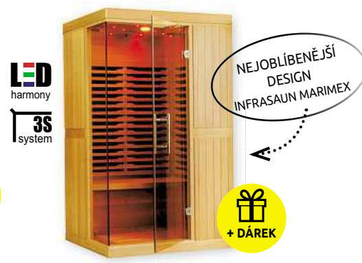
Infra sauna Marimex ELEGANT 3001 L