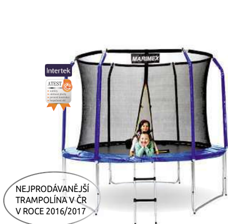
Trampolína Marimex 305 cm schůdky a vnitřní ochranná síť ZDARMA