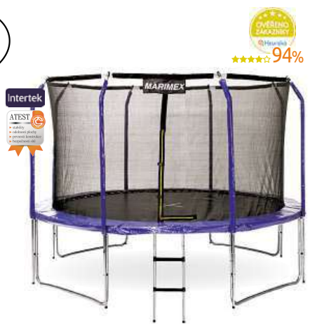
Trampolína Marimex 366 cm schůdky a vnitřní ochranná síť ZDARMA