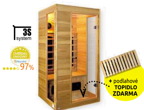
Infra sauna Marimex SMART 1000 M