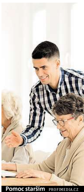
Pomoc starším

Ochota a chuť pomáhat není mládeži ve Zlínském kraji vlastní. Podle průzkumu, který pro Nadaci O 2 zpracovala agentura Ipsos, si to myslí drtivá většina místních nad 30 let. Ti se domnívají, že mladí svůj volný čas tráví nejraději u počítače nebo návštěvou kavárny či baru. Podle zástupců mladší generace je ale pravda úplně jinde. Jejich aktivní pomoc komunitě potvrzují i veřejně prospěšné projekty, které Nadace O 2 v kraji podpoří-