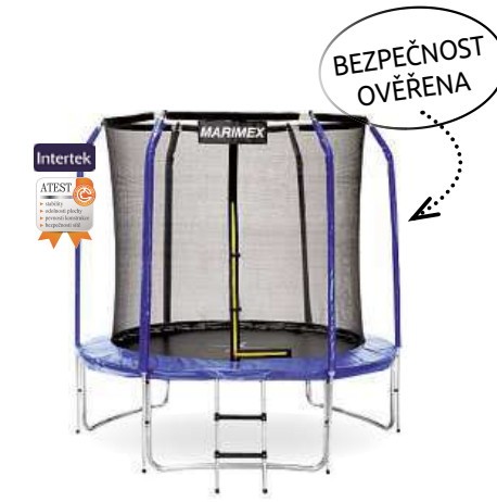
Trampolína Marimex 244 cm schůdky a vnitřní ochranná síť ZDARMA