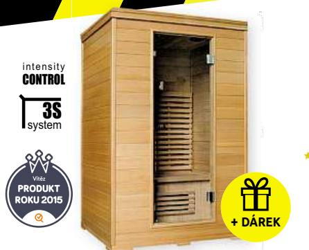
Infra sauna Marimex POPULAR 3000 L

ROZDÁVÁME DÁRKY k INFRASAUNÁM jen do 20. 11.