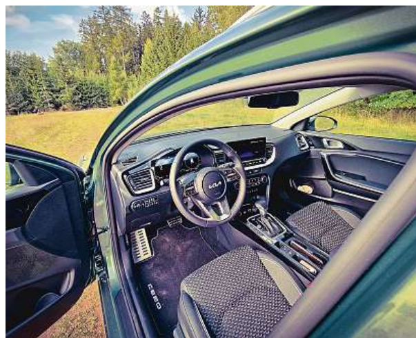
Nevypadá hned jako raketa, jež přiletla z vesmíru, přesto působí moderním dojmem. Facelift modelu Ceed pomohl.

mi repráky JBL vůbec více toho rokenrolu k předjíždění a rychlejší jízdě.