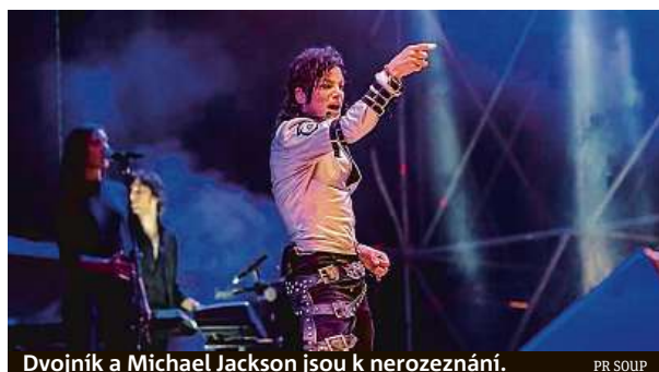
Dvojník a Michael Jackson jsou k nerozeznání.