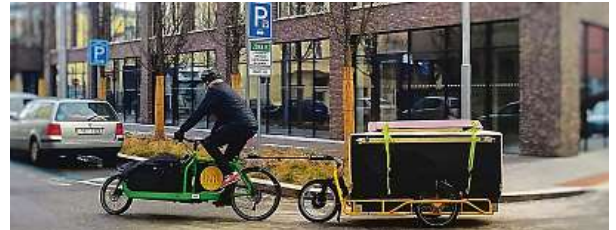
Bez dotace další provoz kol není možný.

V Brně však pro tuto chvíli veřejná půjčovna končí. „Půjčovna v tomto formátu může fungovat pouze jako veřejná služba, stejně jako MHD či senior taxi. Půjčovna není drahá, podle jejích parametrů je nutná provozní dotace kolem půl milionu korun ročně. Což je v kontextu stamilionových a miliardových městských rozpočtů na dopravu kapka v moři,“ říká Šin-