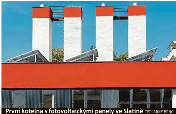
První kotelna s fotovoltaickými panely ve Slatině, TEPLÁRNY BRNO

První konkrétní ukázkou tohoto trendu je kotelna na Jihomoravském náměstí ve Slatině. Tato kotelna v současnosti zásobuje teplem a teplou vodou kromě obchodního centra také takřka tři sta