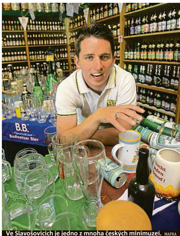
Ve Slavošovicích je jedno z mnoha českých minimuzeí.

Nemusíte mít rádi pivo, dokonce můžete být abstinenti. Ale nic vám nebrání, abyste se při toulkách vydali například do některého z pivních muzeí. Mnohá jsou součástí pivovarů, jiná představují pivovárství samostatně.