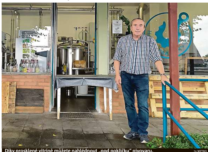
Díky prosklené vitrině můžete nahlédnout „pod pokličku“ pivovaru.

Ke zlatavému moku se dostal přes manžela své neteře, který pivovary vyráběl. Původně pro ně dělal parní kotle, nakonec ale začal společně se strojírenskou společností Rolf antikor vytvářet celou technologii. Jejich pivovary najdete nejen v Česku. Něko-