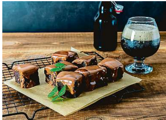
Pivo s čokoládovým brownies? Dobrota!

Ladit jídlo s vínem je normální. Víte však, co se hodí k rybě nebo hamburgeru?