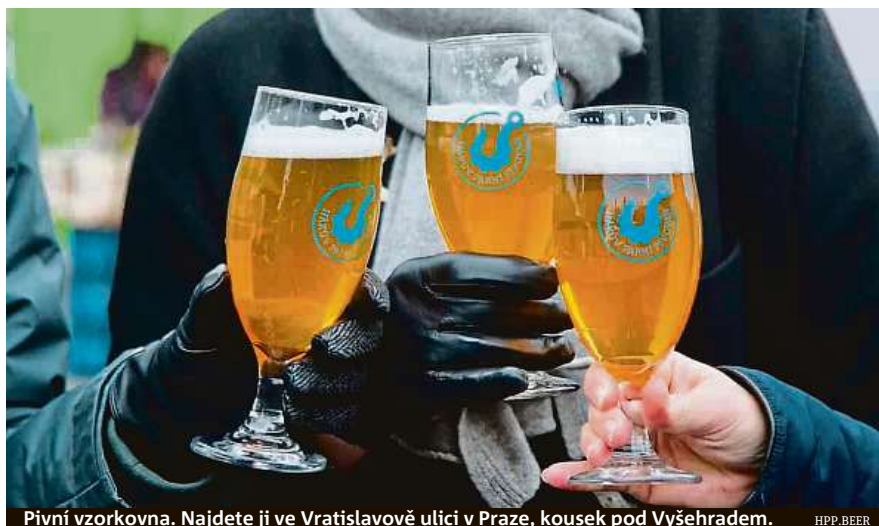
Pivní vzorkovna. Najdete ji ve Vratislavově ulici v Praze, kousek pod Vyšehradem.