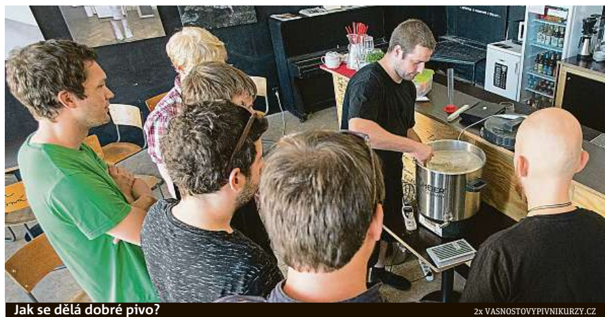
Jak se dělá dobré pivo?

Na první pohled vysoká suma, že? Ale vezměte si, že pak můžete doma uvařit takové speciály, které by vás v obchodě vyšly přes 150 korun za 0,75l lahev... Várku přitom máte v desítkách litrů. Posledně jsme s kamarádem od oka počítali náklady na běžné domácí pivo. A bez započtení ceny elektřiny a vlastní práce jsme se dostali na cenu okolo 15 korun za půllitr. To už se vám počáteční investice díky konzumaci rychle vrátí zpátky. DAVID HALATKA