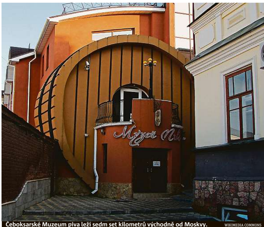
Čeboksarské Muzeum piva leží sedm set kilometrů východně od Moskvy.

Jedno z nejmenších, ale současně jedno z největších