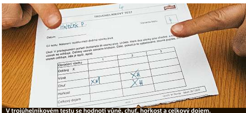
V trojúhelníkovém testu se hodnotí vůně, chuť, hořkost a celkový dojem.