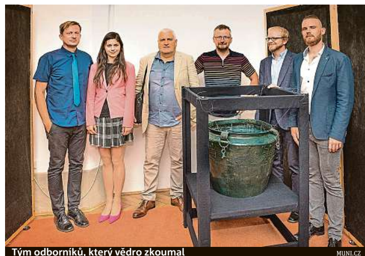
Tým odborníků, který vědro zkoumal

Možná nejstarší bylinné pivo v Evropě se vařilo na Pardubicku. Ukázal to výzkum 3000 let staré bronzové nádoby z Kladiny, nález je z roku 2017.