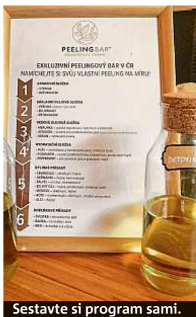
Sestavte si program sami.