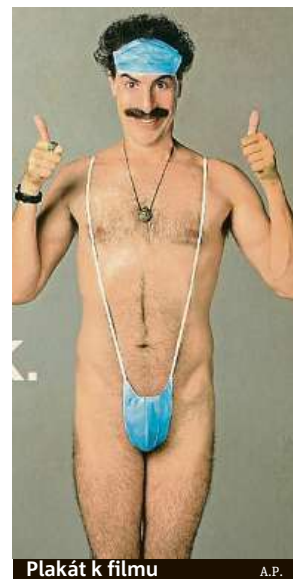
Plakát k filmu

Borat tak bude v on-line společnosti nejúspěšnějšího českého dokumentu režiséru Barbory Chalupové a Víta Klusáka V Síti. Ten je k dispozici na iTunes, O2TV, Aerovodu, Prima Play a dalších místech on-line distribuce již od minulého týdne. JAR