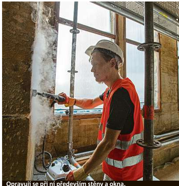
Opravují se při ní především stěny a okna.