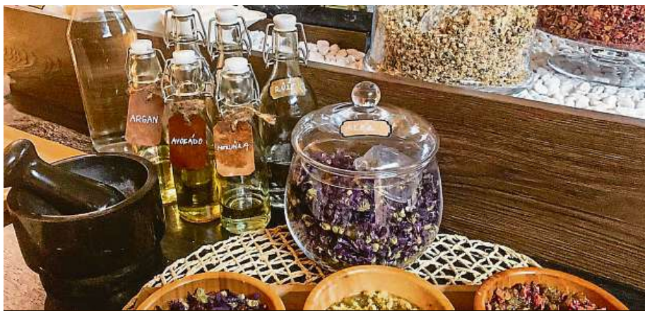
Bar nabízí výživné, detoxikační a zklidňující oleje.

Bar nabízí výživné, detoxikační a zklidňující oleje, ke kterým na závěr přidáte bylinné přísady a hydratační složky. S výběrem správných ingrediencí a olejových složek je k dispozici peeling master, který vám pomůže peeling namíchat. Více informací naleznete na www.aquapalace.cz . MET