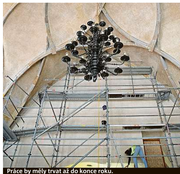
Práce by měly trvat až do konce roku.

Pozdně gotický Vladislavský sál vznikl v letech 1490 až 1502 pod vedením architekta Benedikta Rejta. Vznikl spojením několika starších prostor na místě, kde bývaly sněmovní sály patrně už od Vratislava II. Ve své době byl největším světským klenutým sálem na světě. ČTK