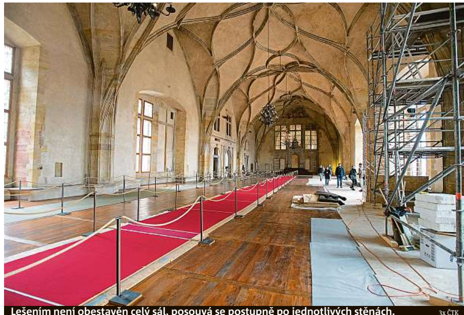
Lešením není obestaven celý sál, posouvá se postupně po jednotlivých stěnách.