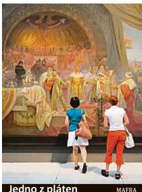
Jedno z pláten

Stěhování Slovanské epopeje Alfonse Muchy na zámek v Moravském Krumlově se odkládá. Důvodem je prodloužení rekonstrukce výstavního prostor. Původně měla být hotova v červnu, termín se však prodloužil do konce roku. O odkladu včera rozhodli pražští radní. Obrazy byly v Krumlově vystaveny od