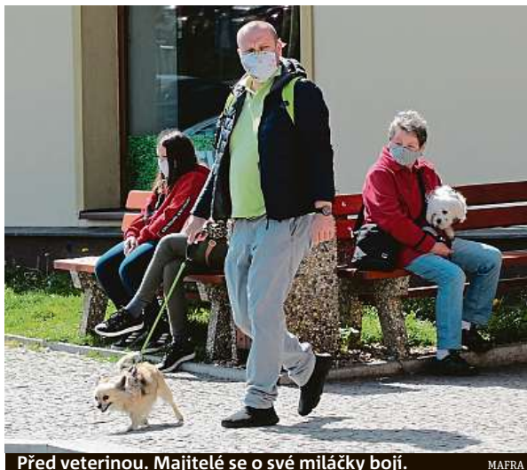
Před veterinou. Majitelé se o své miláčky bojí.