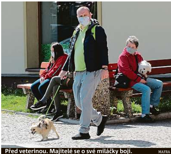
Před veterinou. Majitelé se o své miláčky bojí.