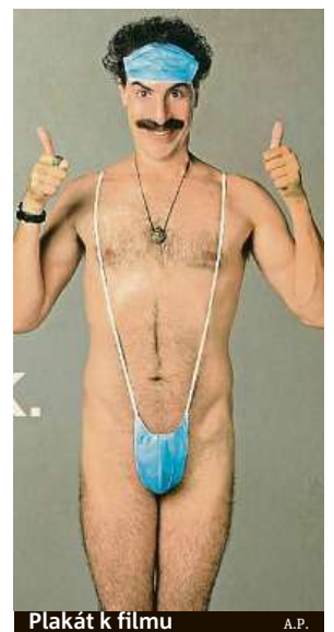
Plakát k filmu

Borat tak bude v on-line společnosti nejúspěšnějšího českého dokumentu režiséřů Barbory Chalupové a Víta Klusáka V Síti. Ten je k dispozici na iTunes, O2TV, Aerovodu, Prima Play a dalších místech on-line distribuce již od minulého týdne. JAR