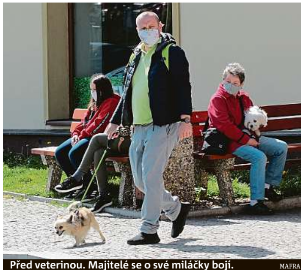
Před veterinou. Majitelé se o své miláčky bojí.