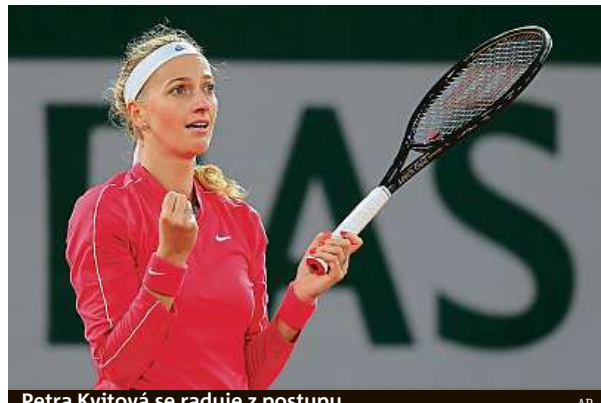
Petra Kvitová se raduje z postupu.

Kvitová začala dobře a za 14 minut vedla 4:0. „Strašně moc foukalo, byla zima a nebylo to vůbec jednoduché. Začátek to možná všechno rozhodl, kdyby zahrála pár těsných gamů, byla by nebezpečná. Jsem ráda, jak to všechno šlo,“ uvedla Kvitová. Ta zavá-