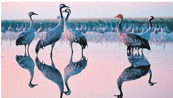
Průvodci vás v říjnu vezmou na tajná místa plameňáků. TMV

Po krmení na polích po sklizni kukuřice či ječmene jeřábi odpočívají v Pramortu, rozsáhlé oblasti bílých písečných dun na poloostrově Zingst. Plaché ptáky lze spatřit s návštěvnickou kartou na