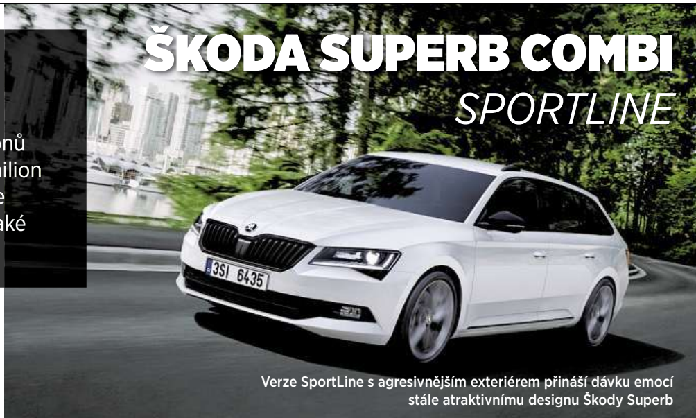
Verze SportLine s agresivnějším exteriérem přináší dávku emocí stále atraktivnímu designu Škody Superb

Od běžných variant se SportLine liší například standardními osmnáctipalcovými dis-