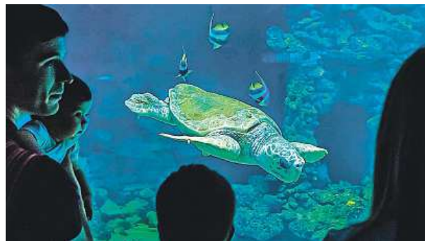
Podmořský svět ve Stralsundu

Hlavním turistickým magnetem ve Stralsundu je Německé mořské muzeum. Za zdmi bývalého kláštera se návštěvníci mohou seznámit s nejrůznějšími obyvateli moře. Zastavit se musíte u akvária Ozeaneum. Funguje necelých deset let. Čtyřicítka akvárií o objemu šest milionů litrů vody představuje podmořský svět Baltského a Severního moře i Severního ledové-