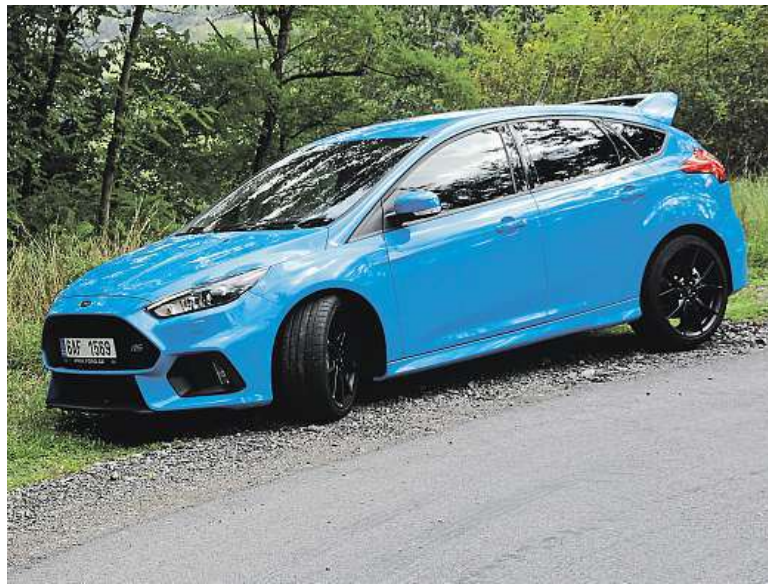
Sport tu zastupují i brzdové třmeny Brembo a sedačky Recaro.