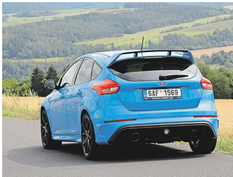
Ctyřvrstvý modrý lak Nitrous vás nejdřív zaskočí, ale pak si zvyknete.