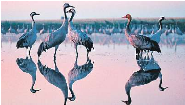
Průvodci vás v říjnu vezmou na tajná místa plameňáků. TMV

Po krmení na polích po sklizni kukuřice či ječmene jeřábi odpočívají v Pramortu, rozsáhlé oblasti bílých písečných dun na poloostrově Zingst. Plaché ptáky lze spatřit s návštěvnickou kartou na