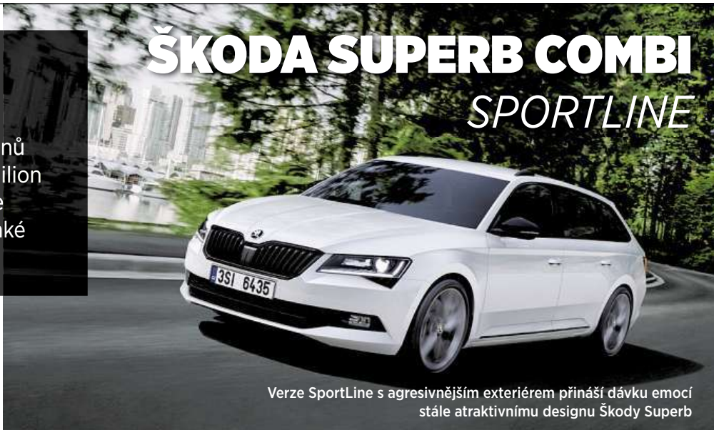
Verze SportLine s agresivnějším exteriérem přináší dávku emocí stále atraktivnímu designu Škody Superb

ky s platinovým vzhledem, jež za příplatek můžete vyměnit za větší 19" kola v antracitovém odstínu, sportovním podvozkem sníženým o 15 milimetrů, zatmavenými bočními okny, vnitřním čalouněním v kombinaci kůže a alcantary, předními sportovními sedadly s integrovanými opěrkami hlavy, koženým volantem se zploštělým spodkem, hliníkovými kryty pedálů či specifickým ozdobným dekorem inspirovaným strukturou uhlíkových vláken. Samozřejmostí je černý paket exteriéru zahrnující kryty vnějších zpětných zrcátek, masku chladiče a lišty dveří. Speciálně pro linii SportLine pak Škoda nabízí unikátní zlatý