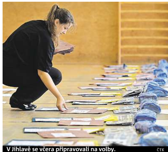
V Jihlavě se včera připravovali na volby.

• Jak se volí? Každý kandidát je uveden na samostatném hlasovacím lístku. Volič pak ve volební místnosti vloží do obálky lístek se jménem vybraného kandidáta. Tento lístek se nijak neupravuje. Lístky pro případné druhé kolo voliči nedostanou předem, ale obdrží je až ve volební místnosti.