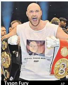
Tyson Fury

Fury měl podle informací televize ESPN pozitivní test na kokain při mimosoutěžní kontrole 22. září. Nikdy však podle svých slov neužíval drogy v době, kdy boxoval. „Ani náhodou, žádné drogy. Nikdy