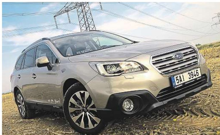
Karoserie je nová, vyrobená z tužší vysokopevnostní oceli.