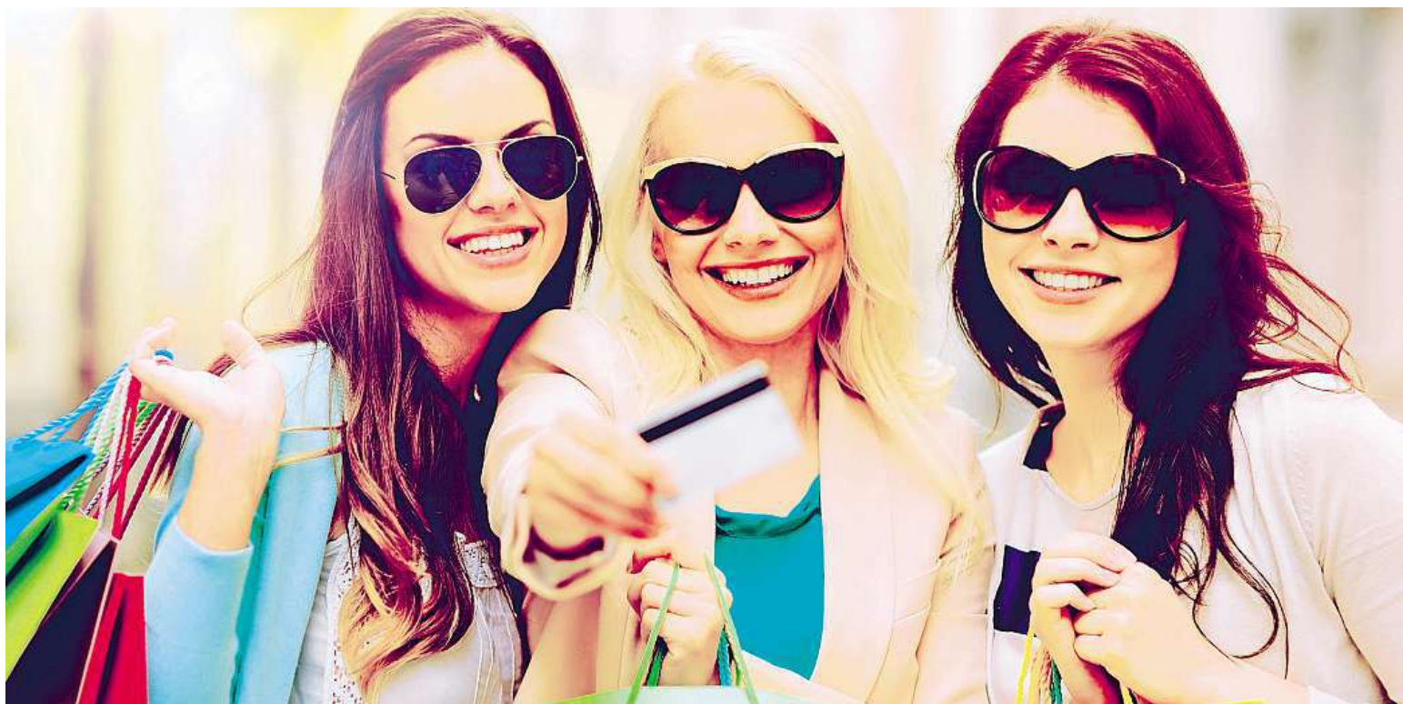
Na nákupy! Mezi 15.–17. hodinou proběhnou každý den stovky tisíc transakcí.