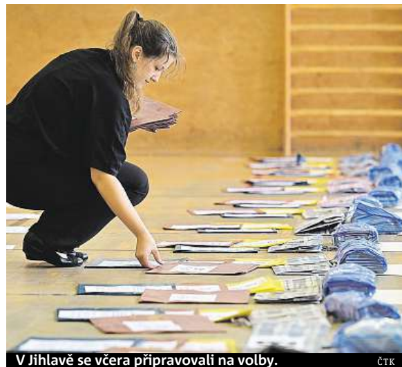
V Jihlavě se včera připravovali na volby.

• Jak se volí? Každý kandidát je uveden na samostatném hlasovacím lístku. Volič pak ve volební místnosti vloží do obálky lístek se jménem vybraného kandidáta. Tento lístek se nijak neupravuje. Lístky pro případné druhé kolo voliči nedostanou předem, ale obdrží je až ve volební místnosti.