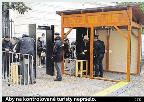
Aby na kontrolované turisty nepršelo.