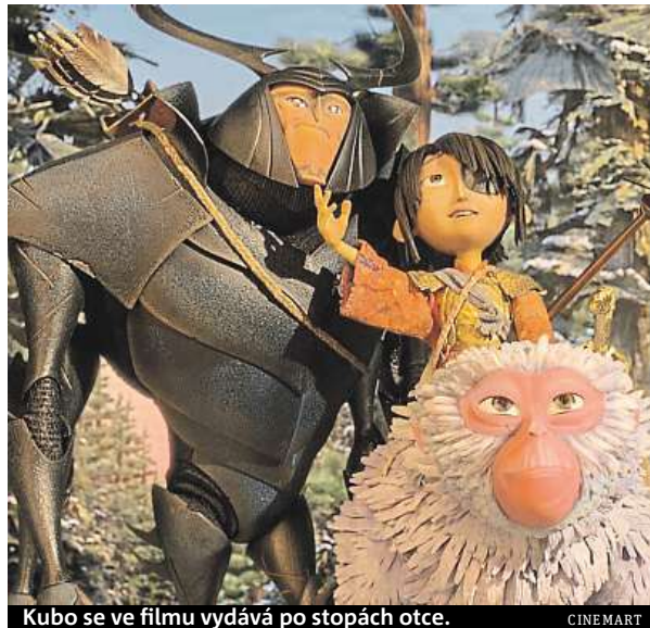
Kubo se ve filmu vydává po stopách otce.

Chlapci Kubovi tenhle talent pomáhá uživit sebe a nemocnou matku. Den co den opouští jeskyni, ve které společně přebývají, a v přilehlé