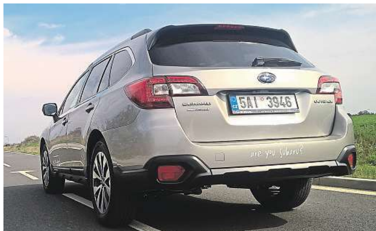
Outback je schopný nejen v terénu, ale je pohodlný i na silnici.