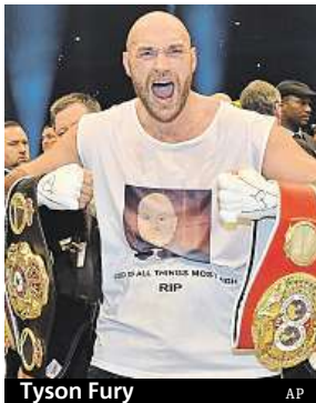
Tyson Fury

Fury měl podle informací televize ESPN pozitivní test na kokain při mimosoutěžní kontrole 22. září. Nikdy však podle svých slov neužíval drogy v době, kdy boxoval. „Ani náhodou, žádné drogy. Nikdy