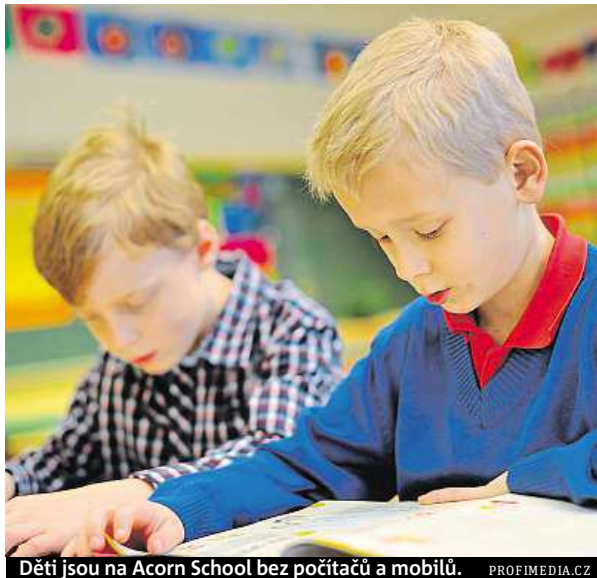
Děti jsou na Acorn School bez počítačů a mobilů.