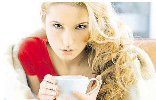
Nezapomeňte na podzim na zázvorový čaj.

Ovocný a černý čaj vám na podzim a v zimě udělají mnohem větší službu než zelený. Nezapomínejte také na zázvorový čaj. „Nejintenzivněji působí šálek obsahující hřebíček, nastrouhané jablko, sušenou nastrouhanou kůru z mandarinky, kustovnicí čínskou, skořicí a zázvor. Považte tři až pět minut, pak nápoj slíjete a pijte ideálně třikrát denně,“ nabádá Škába.