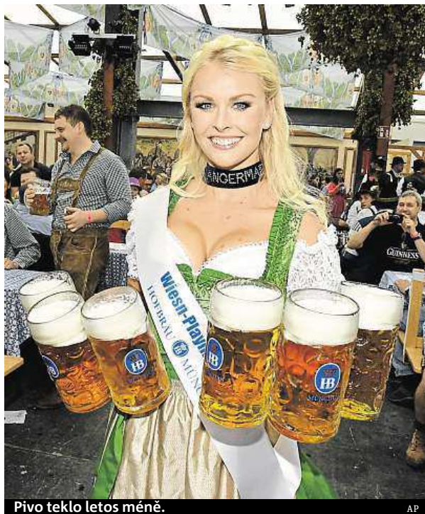
Pivo teklo letos méně.

Proti loňsku ubylo krádeží, policisté ale museli zastavit