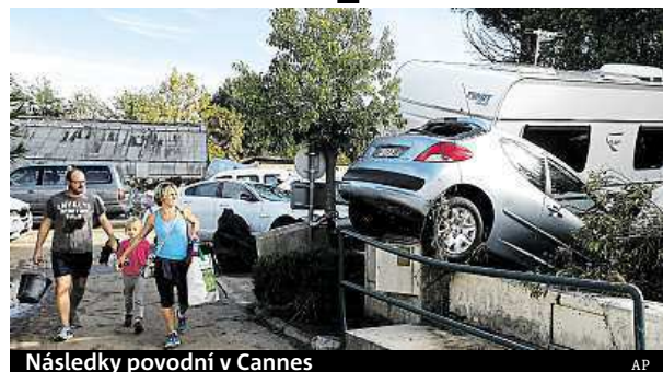
Následky povodní v Cannes

Počet obětí víkendových lijákových a bleskových záplav na jihu Francie, jež zasáhly okolí festivalového města Cannes, vystoupil na nejméně devatenáct. V regionu Provence-Alpes-Côte d'Azur se pohřbují nejméně tři lidé. Oběti většinou utonuly v náhlých přívalcích vody, řada z nich se snažila přeparkovat své vozy do bezpečí. V sobotu během dvou hodin napršelo až 17 centimetrů vody. ČTK