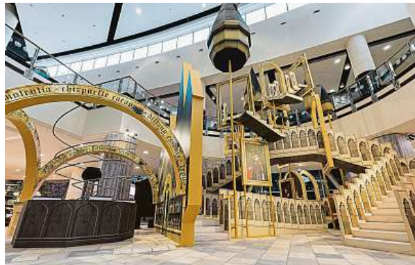
Kulisy navodí atmosféru chodeb Bradavic.

Akce přinese zájemcům příležitost prohlédnout si například stylizovanou repliku vlaku Bradavický expres, projít Hagridovu chatrčiči nebo si vyzkoušet nejoblíbenější hru kouzelníků – famfrpál.