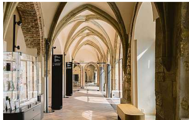
Díky rekonstrukci vzniklo v prostorách Staroměstské radnice nové turistické informační centrum.

Rekonstrukce začala loni v březnu a byla dokončena letos v srpnu. Metropole vyčlenila 40 milionů korun. Vedle nového turistického informačního centra a zpřístupnění průchodu mohou návštěvníci zavítat do zbrusu nové