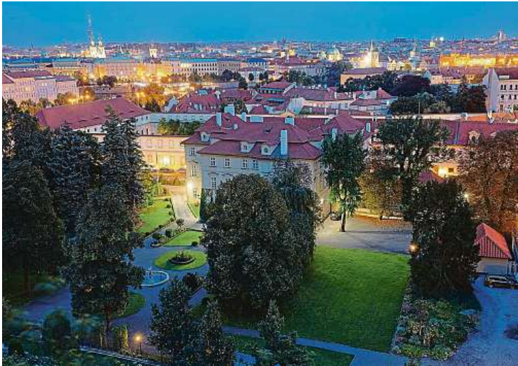
Při hře můžete pozorovat zahrady kolem Hradu doslova v jiném světle. LUBOŠ BÁRTA