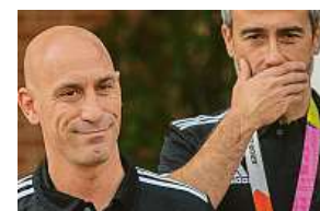
Luis Rubiales (vlevo) a Jorge Vilda