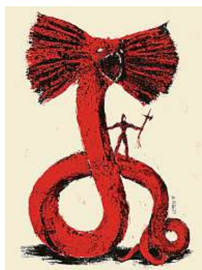
Ukázka z ilustrací MARTIN LACKO

Všichni, koho ilustrace a komiks zajímají, si to své v programu desátého Lustru najdou, letos poprvé v Holešovické tržnici v Praze. Dveře festivalu se otevrou vernisáží 21. září v 18 hodin a výstavy i workshopy je možné navštívit až do 26. září. MET