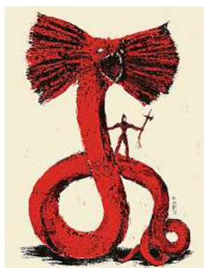
Ukázka z ilustrací MARTIN LACKO

Všichni, koho ilustrace a komiks zajímají, si to své v programu desátého Lustru najdou, letos poprvé v Holešovičské tržnici v Praze. Dveře festivalu se otevrou vernisáží 21. září v 18 hodin a výstavy i workshopy je možné navštívit až do 26. září. MET