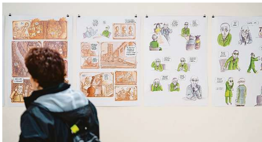
Festival ilustrace a komiksu pravidelně nabízí hned několik výstav.