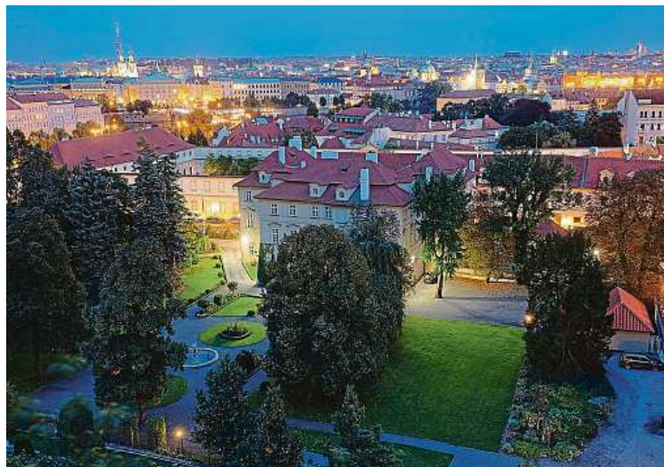
Při hře můžete pozorovat zahrady kolem Hradu doslova v jiném světle. LUBOŠ BÁRTA