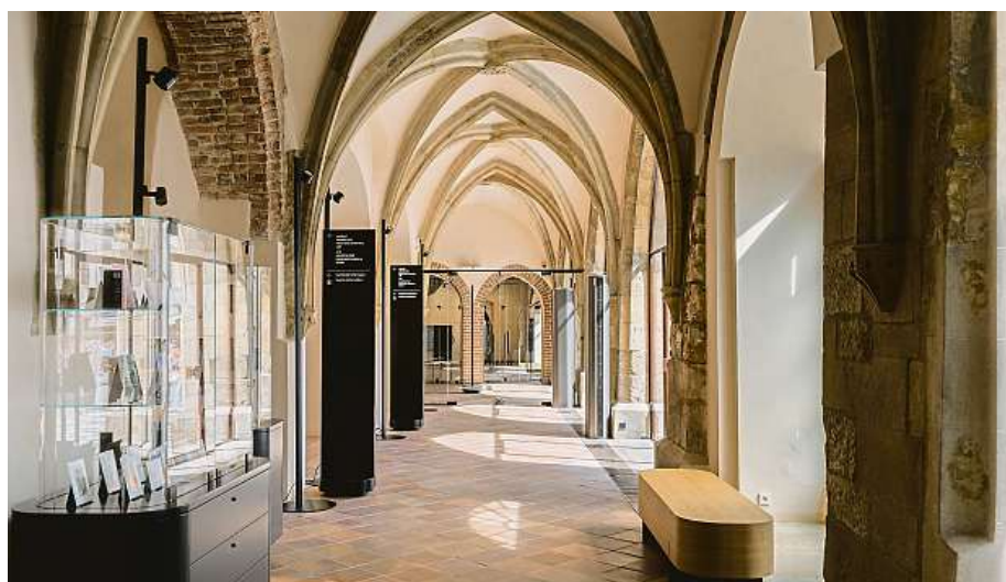
Díky rekonstrukci vzniklo v prostorách pražské Staroměstské radnice zcela nové turistické informační centrum.

Po dosavadních úpravách se město v následujících letech zaměří na podzemí radnice, které je starší než budova samotná. Komplex středověkých sálů, chodeb a tunelů je zároveň největším svého druhu v Praze. Staroměstská radnice patří k nejoblíbenějším pražským památkám. V roce 2022 byla sedmou nejnavštěvovanější v Praze. TES