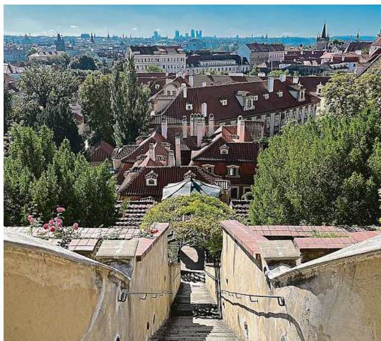
Výhled z Malé Fürstenberské zahrady

Ten má jako pořadatel s podobnými akcemi bohaté zkušenosti. Již několikrát totiž zorganizoval oblíbenou hru Pražské věže, která zájemce zavede mimo jiné i do běžně nepřístupných míst. Také nedělní akce je příležitostí nahlédnout do méně známých prostor. „V Rajské zahradě bude zcela mimořádně otevřený Matyášův pavilon, který nechal vybudovat bratr císaře Rudolfa II.,“ zve na jednu z perliček Horský. MAREK HÝŘ