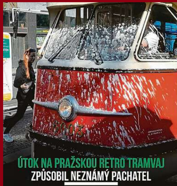
ÚTOK NA PRAŽSKOU RETRO TRAMVAJ ZPŮSOBIL NEZNÁMÝ PACHATEL

Pražská retro tramvaj Tatra T2 evidenčního čísla 6003 byla včera zachycena v ulicích Prahy po ataku neznámého vandala. Další vývoj situace a jiné novinky z Prahy a MHD najdete na našem profilu na Instagramu @mojemetro. #metrotag #mojemetro