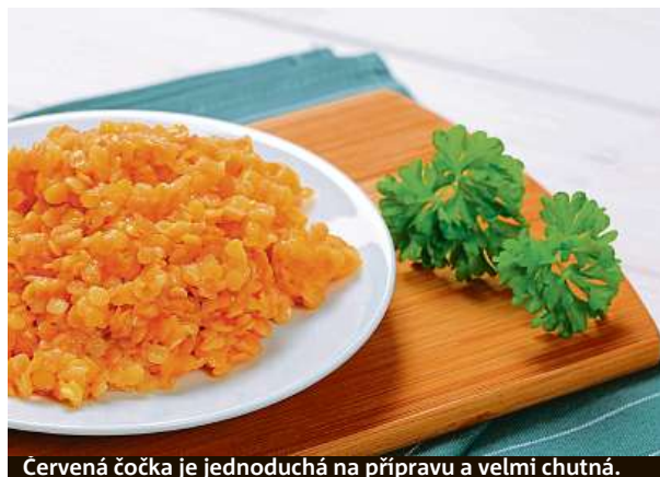
Červená čočka je jednoduchá na přípravu a velmi chutná.

Kornbagetu nejprve podélně prokrojíte, spodní půlku namažeme čerstvým sýrem, přidáme lístky rukoly a poklademe střídavě plátky rajčat, mozzarellou a srolované goudy. Přidáme pesto, lehce pokapeme olivovým olejem a přiklopíme druhou půlkou kornbagety. KAMILA HUDEČKOVÁ