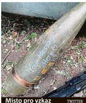
Místo pro vzkaz TWITTER

O to větší ohlas vzbudilo kyjevské videoherní studio Frogwares, které shání prostředky na svoji připravovanou hru o detektivu Sherlocku Holmesovi. „Těm, kdo nám přispějí nejvíce, garantujeme zanechání vzkazu na dělostřeleckém náboji vypáleném na frontě ukrajinskou armádou,“ uvedli vývojáři pro videoherní časopis PC Gamer.