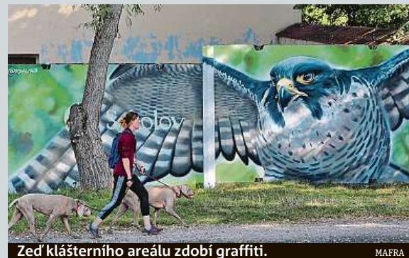
Zed' klášterního areálu zdobí graffiti.