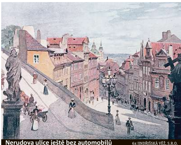
Nerudova ulice ještě bez automobilů