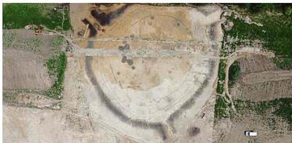
Pohled na rondel z ptačí perspektivy

„Odhaduji, že se dostane na asi 90 procent celkového půdorysu, to je pro archeologii mimořádná příležitost. V Evropě se takto odkrylo jen kolem deseti rondelů,“ vysvětluje Jaroslav Řídký z AV ČR, který se tematikou rondelů zabývá. MET