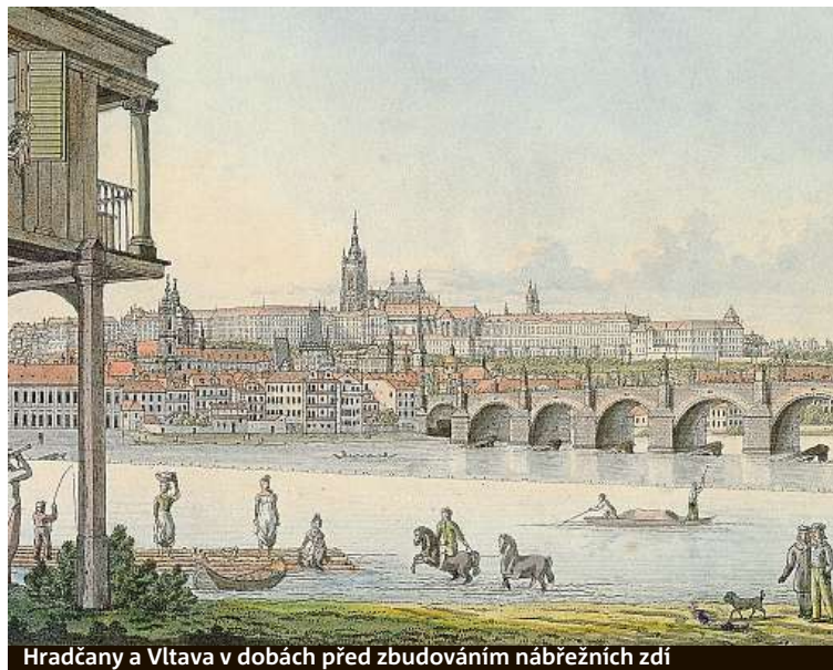
Hradčany a Vltava v dobách před zbudováním nábrežních zdí