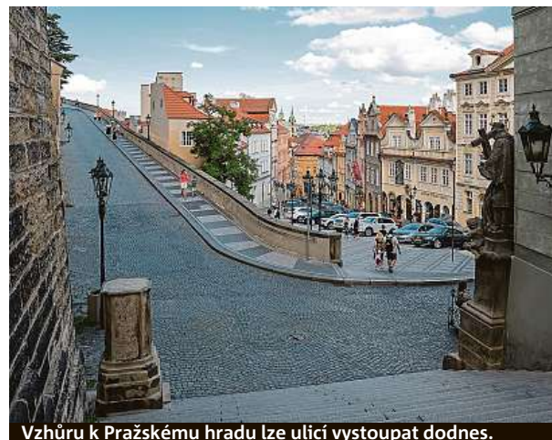
Vzhůru k Pražskému hradu lze ulicí vystoupat dodnes.

V druhé polovině devatenáctého století vstoupila do Prahy průmyslová revoluce. I to je podle Dolfi z pochopitelných důvodů fenomén, který je na srovnávacích patrný. „Na tehdejších perife-