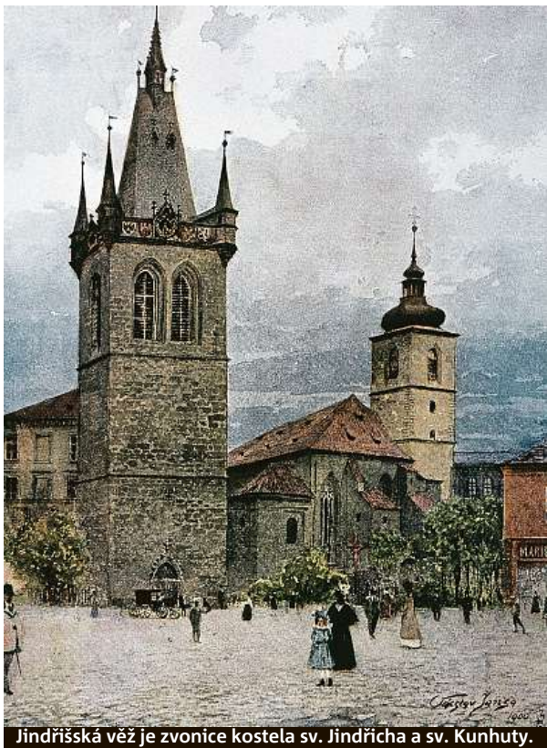
Jindřišská věž je zvonice kostela sv. Jindřicha a sv. Kunhuty.