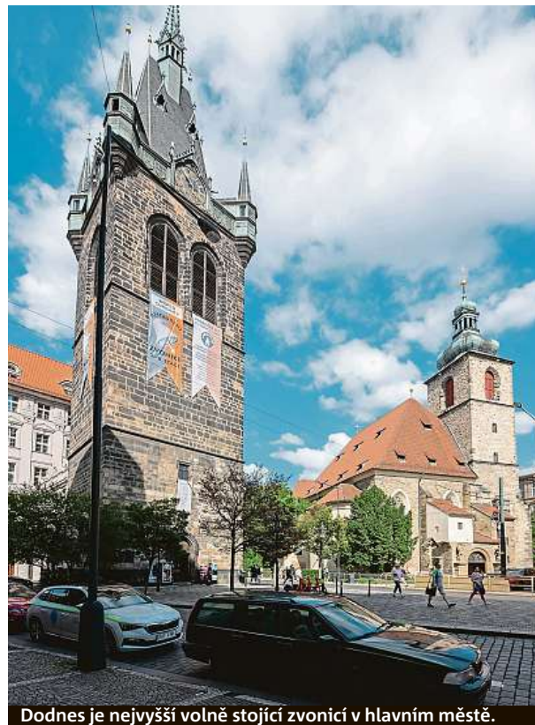
Dodnes je nejvyšší volně stojící zvonici v hlavním městě.