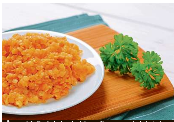
Červená čočka je jednoduchá na přípravu a velmi chutná.

Kornbagetu nejprve podélně prokrojíte, spodní půlku namažeme čerstvým sýrem, přidáme lístky rukoly a poklademe střídavě plátky rajčat, mozzarellou a srolované goudy. Přidáme pesto, lehce pokapeme olivovým olejem a přiklopíme druhou půlkou kornbagety. KAMILA HUDEČKOVÁ