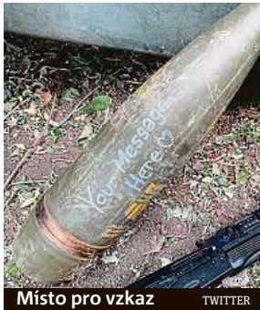
Místo pro vzkaz TWITTER

O to větší ohlas vzbudilo kyjevské videoherní studio Frogwares, které shání prostředky na svoji připravovanou hru o detektivu Sherlocku Holmesovi. „Těm, kdo nám přispějí nejvíce, garantujeme zanechání vzkazu na dělostřeleckém náboji vypáleném na frontě ukrajinskou armádou,“ uvedli vývojáři pro videoherní časopis PC Gamer.