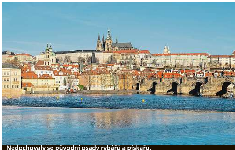
Nedochovaly se původní osady rybářů a pískářů.