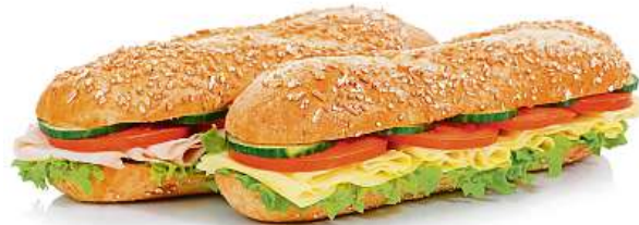
Ke svačině je vhodné celozrnné pečivo.

Postup je jednoduchý. Na oleji orestujte na kostičky nakrájenou cibuli, utřený česnek a nahrubo nastrouhanou mrkev. Přidejte propláchnutou červenou čočku a restujte cca pět minut. Vše zalijte 100 mililitry horké vody a společně vařte přibližně dvacet minut, dokud se voda nevyvaří. Nechejte zchladnout. Pak dochuťte solí, česnekem a citronovou šťávou.