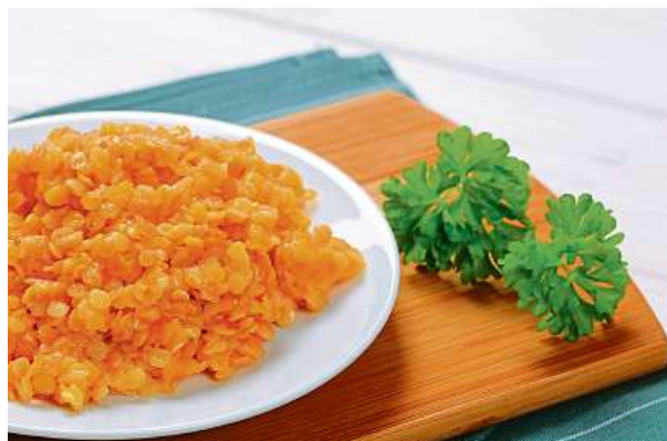
Červená čočka je jednoduchá na přípravu a velmi chutná.

Kornbagetu nejprve podélně prokrojíte, spodní půlku namažeme čerstvým sýrem, přidáme lístky rukoly a poklademe střídavě plátky rajčat, mozzarellou a srolované goudy. Přidáme pesto, lehce pokapeme olivovým olejem a přiklopíme druhou půlkou kornbagety. KAMILA HUDEČKOVÁ