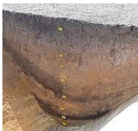
Zásypové vrstvy příkopu

Rondel ve Vinoři byl objeven už v 80. letech 20. století při stavbě inženýrských sítí.