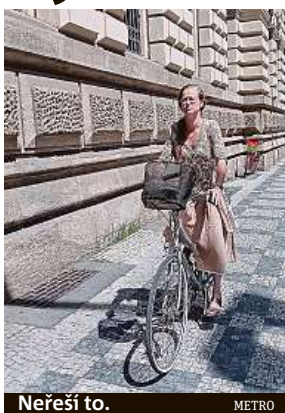
Nereš to. METRO

Znalost zákona o provozu na pozemních komunikacích se ale vztahuje i na cyklisty, bez ohledu na to, zda mají, nebo nemají řidičský průkaz. Obvyklým argumentem,