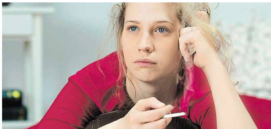
Kouření vám od deprese a stresu nepomůže.

„To, že nikotin vdechují z cigaretového kouře spolu s několika tisíci látkami