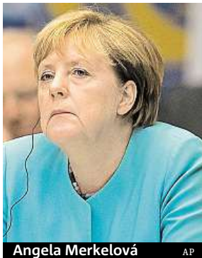
Angela Merkelová

Výsledek hlasování, který byl pro CDU v Meklenbursku-Předním Pomořansku