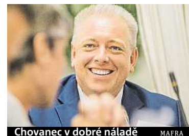
Chovanec v dobré náladě