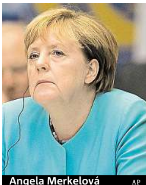
Angela Merkelová

Výsledek hlasování, který byl pro CDU v Meklenbursku-Předním Pomořansku