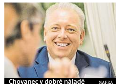
Chovanec v dobré náladě

Člen vyšetřovací komise Martin Lank (Úsvit) uvedl, že podle něj je na hodnocení nového útvaru příliš brzy. „Pan ministr odpověděl na všechno,