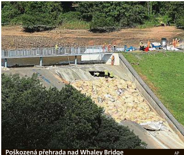
Poškozená přehrada nad Whaley Bridge

Whaley Bridge muselo minulý čtvrtek opustit asi 1500 obyvatel poté, co hráz poškodily silné lijáky. Od té doby s pomocí 24 vysokotlakých pump odčerpali více než třetinu vody z nádrže Toddbrook a vojáci za pomoci vrtulníku hráz vyztužili stovkami tun