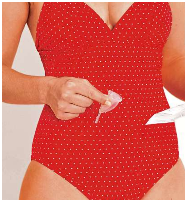
Přichází měsíc co měsíc.