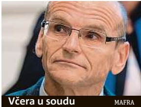
Včera u soudu