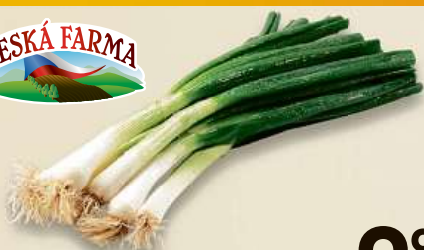
Cibulka lahůdková svazek, 1 ks Česká republika