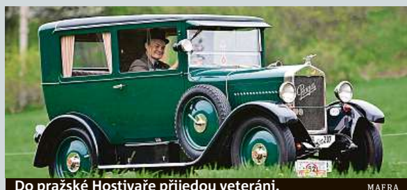
Do pražské Hostivaře přijedou veteráni.

V Golf klubu Hostivař v Praze se 25. srpna uskupteční první ročník výstavy historických vozidel. Diváci uvidí na 70 prvorepublikových strojů všech devíti hlavních československých značek. Budou tu také módní přehlídky, zajímavé přednášky i akce pro děti. MAP