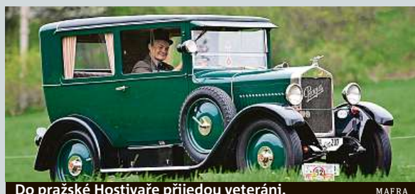
Do pražské Hostivaře přijedou veteráni.

V Golf klubu Hostivař v Praze se 25. srpna uskupteční první ročník výstavy historických vozidel. Diváci uvidí na 70 prvorepublikových strojů všech devíti hlavních československých značek. Budou tu také módní přehlídky, zajímavé přednášky i akce pro děti. MAP