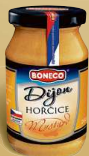
Boneco Hořčice Dijon 260 g