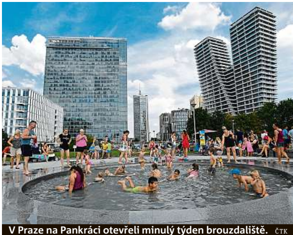
V Praze na Pankráci otevřeli minulý týden brouzdaliště.

Vedle Řeže zaznamenala nejvyšší teplotu stanice v Poděbradech na Nymbursku. Tam si hýčkali teplotní rekord ještě z protektorátních časů, kde v roce 1943 naměřili 35,8 stupně. Tento víkend jim k historickému údaji přibyl ještě dvě desetiny stupně. Přes šestatřicet stupňů se dostala ještě teplota v Dolním Bousově na Mladoboleslavsku, kde bylo 36,4 stupně, nebo v Mokošíně na Pardubicku, kde šestatřicetku překonali o jednu desetinu