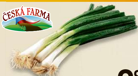
Cibulka lahůdková svazek, 1 ks Česká republika