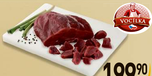
Hovězí maso na guláš cena za 1 kg