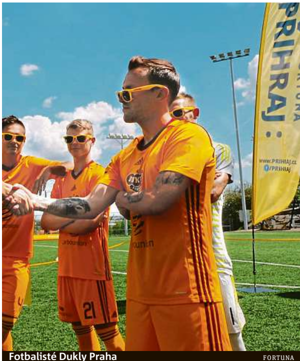
Fotbalisté Dukly Praha

Fotbalovou střelnici si poprvé můžete vyzkoušet dnes na Dukle, ale ani fanouškové ostatních týmů FORTUNA: LIGY nemusí zoufat.