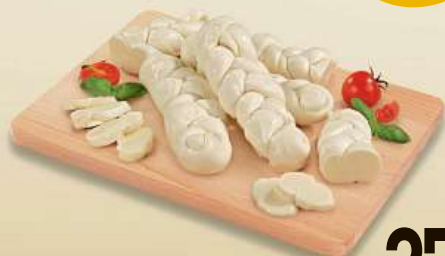
Jadel 37% t. vs. z pultu lahůdek cena za 100 g