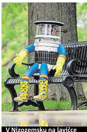
V Nizozemsku na lavičce