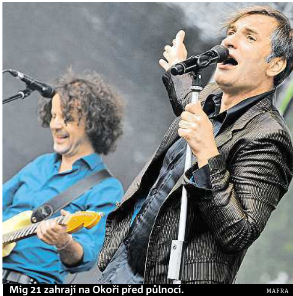
Mig 21 zahrají na Okoři před půlnocí.