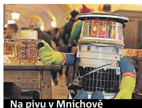
Na pivo v Mnichově

Podle Smithe byl robot experimentem, jehož cílem bylo prozkoumat, jak na lidi bude působit technologický přístroj, který je stále sofistikovanější a lidštější. „Chci prozkoumat svět a poznat nové lidi,“ uvádí HitchBOT