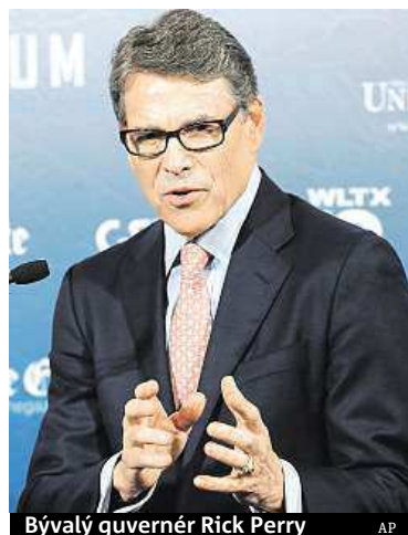
Bývalý guvernér Rick Perry

Perry v roce 2008 patřil k hlavním uchazečům o nominaci. Ale tentokrát se všechny oči upírají na Trumpa proslulého kontroverzními výroky a agresivitou, který vede nynější průzkumy. Svě soupeře už stačil pozorávat jako slabochy, idioty a neschopné si vydělávat jinak než politikou. ČTK