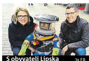
S obyvateli Lipska

na svých webových stránkách m.hitchbot.me.