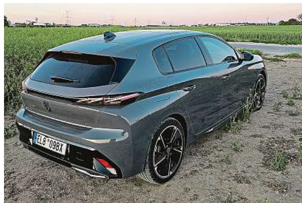
Nový design kol a pneumatik pomáhá zvýšit dojezd.