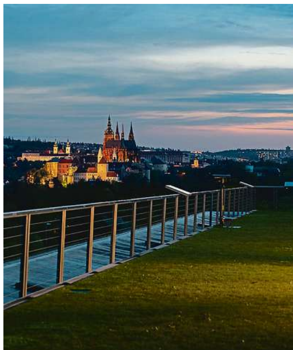
Ze střechy Národního zemědělského muzea je krásný výhled.