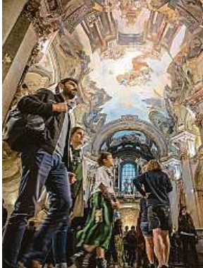
Kostel svatého Mikuláše na Malé Straně