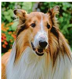
Lassie je zpět v novém filmovém dobrodružství.

Ve skotském dialektu znamená jméno Lassie děvče. Fenomén psí hrdinky začal povídkou britského spisovatele Erica Knighta, kterou zveřejnila noviny Saturday Evening Post již v roce 1938. K jejímu sepsání ho inspirovala vlastní kolie, která vynikala vysokou inteligencí, rozuměla nezvyklému počtu slov a reagovala na řadu pokynů. Povídky