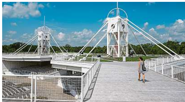
Pavilony se nacházejí v dolní části areálu Výstaviště Praha.