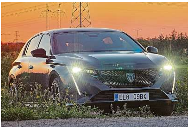
Design Peugeotu 308 se povedl, nejzajímavěji působí světla.