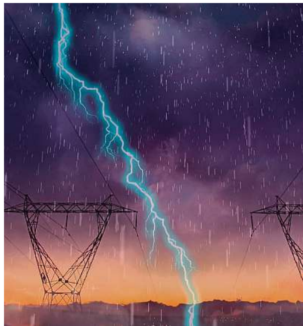
S bouřkami a větrem se některé regiony Česka potýkaly už v uplynulých dnech.

Podle ankety České tiskové kanceláře mezi pojišťovnami bouřky způsobily o víkendu škody za desítky milionů korun. Deště také rozvodnily řeky, ještě včera ráno zůstávaly toky na sedmi místech v Česku na nejnižším, prvním povodňovém stupni. ČTK