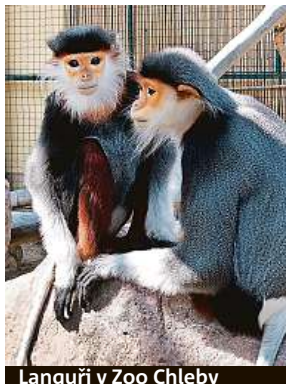
Languři v Zoo Chleby

Zoo Chleby poblíž Nymburka oslavila včera 25 let od za-