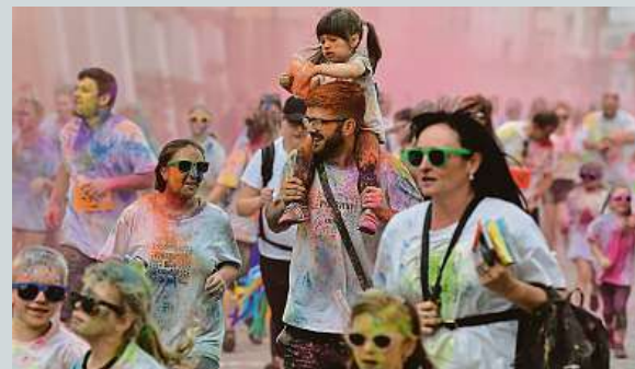
Sportovní akce Vybarvený běh v Kroměříži.