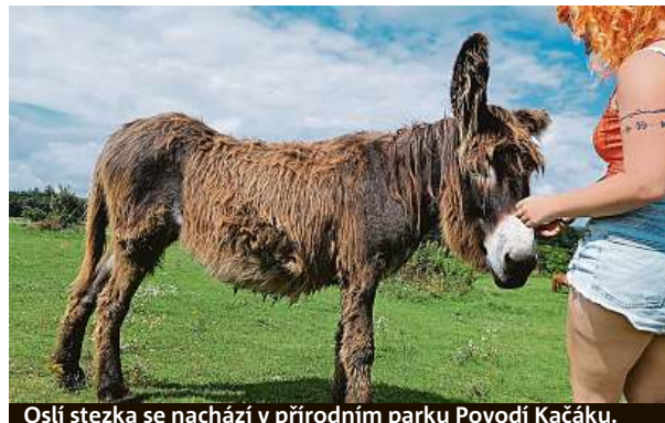
Oslí stezka se nachází v přírodním parku Povodí Kačáku.

ložení. Je to první porevoluční nestátní oficiální zoologická zahrada v České republice. Návštěvníci v ní poznají takové pány zvířat, jako jsou amazónan rudocasy, ara hyacintový, dvojzoborožec indický anebo tukan pestrý. Dohromady je v ní k vidění přes 420 zvířat ve zhruba 120 druzích. Zastoupeny jsou všechny skupiny od nejpočetnějších savců a ptáků přes plazy a obojživelníky až po ryby a bezobratlé ze všech kontinentů kromě Antarktidy.