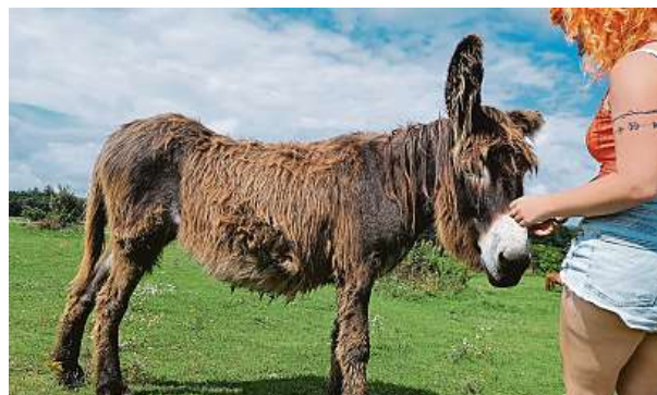
Oslí stezka se nachází v přírodním parku Povodí Kačáku.

ložením. Je to první porevoluční nestátní oficiální zoologická zahrada v České republice. Návštěvníci v ní poznají takové pány zvířat, jako jsou amazónan rudocasy, ara hyacintový, dvojzoborožec indický anebo tukan pestrý. Dohromady je v ní k vidění přes 420 zvířat ve zhruba 120 druzích. Zastoupeny jsou všechny skupiny od nejpočetnějších savců a ptáků přes plazy a obojživelníky až po ryby a bezobratlé ze všech kontinentů kromě Antarktidy.