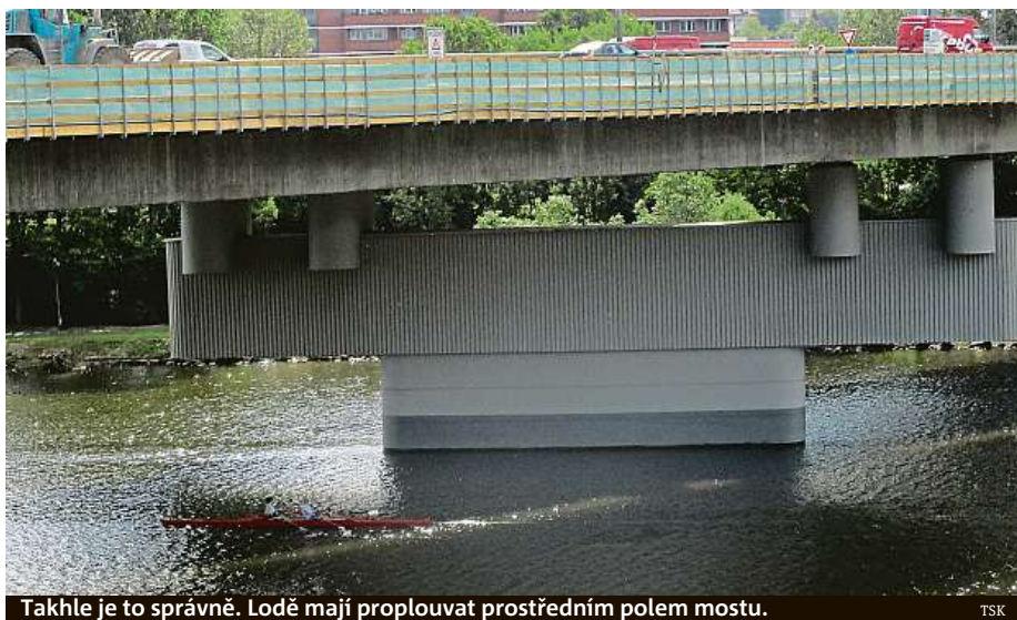
Takhle je to správně. Lodě mají proplouvat prostředním polem mostu. TSK

Oprava dopravní tepny uzavřela plavební dráhy v krajních polích mostu. „Na některé prosby neplatí,“ tvrdí TSK.