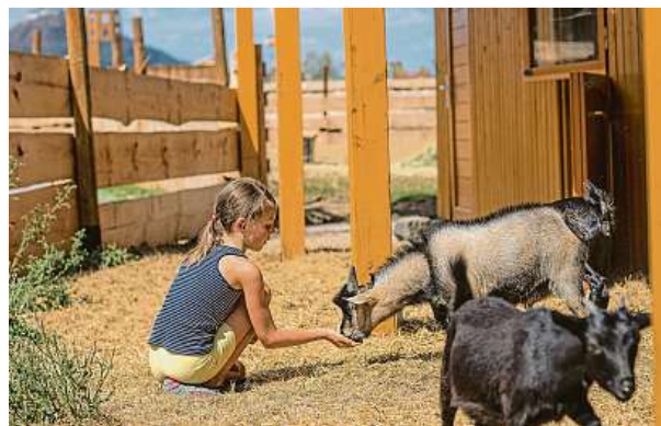
Krmení ve Vrchbělé

4x STŘEDOČESKÁ CENTRÁLA CESTOVNÍHO RUCHU