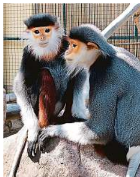
Languři v Zoo Chleby

Zoo Chleby poblíž Nymburka oslavila včera 25 let od za-