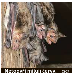
Netopýří milují červy. ČSOP

Důchodcům z Prahy 10 dělali dřív společnost noční letci. Teď si za nimi výletují.