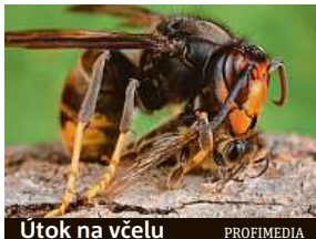
Útok na včelu

Sršně asijské jsou už v Německu. Ničí včelstva, útočí i na člověka.