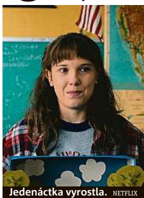
Jedenáctka vyrostla.

Co se obsazení týče, hostující hvězdy je zde například herec Robert Englund, představitel slavného Freddyho Kruegera ze série Noční můra z Elm Street. Ten tu hraje tak trochu jiného „vrahouna“. A co se týče produkčních hodnot, třicet milionů dolarů utracených za jednu epizodu je tu sakra vidět. O skvělém audiovizuálním zážitku tak není ani třeba mluvit. Další větších změn tu mnoho