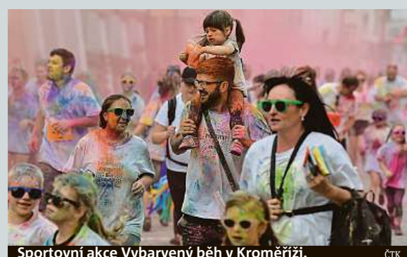
Sportovní akce Vybarvený běh v Kroměříži.