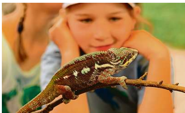
Chameleona si můžete prohlédnout v Zooparku Zájezd.

Pěkná minizoo se nachází také v rekreačním areálu Vrchbělá. „Vrchbélou si zamilují malí i velcí nejen proto, že se tam dá krásně relaxovat, poznávat okolí, jezdit na kole i na bruslích, hrát si na dětském hřišti anebo si dopřát trochu adrenalinu v lanovém centru. Magnetem jsou také zvířata v tamější minizoo. Velkým zážitkem je pozorovat je zblízka při krmení,“ dodává Jakub Kulhánek, vedoucí marketingu Středočeské centrály cestovního ruchu. Více informací najdete na www.strednicechy.cz . MET