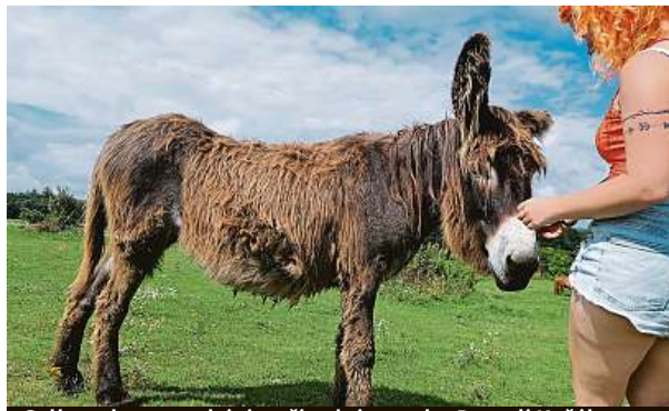
Oslí stezka se nachází v přírodním parku Povodí Kačáku.

ložení. Je to první porevoluční nestátní oficiální zoologická zahrada v České republice. Návštěvníci v ní poznají takové pány zvířat, jako jsou amazónan rudocasy, ara hyacintový, dvojzoborožec indický anebo tukan pestrý. Dohromady je v ní k vidění přes 420 zvířat ve zhruba 120 druzích. Zastoupeny jsou všechny skupiny od nejpočetnějších savců a ptáků přes plazy a obojživelníky až po ryby a bezobratlé ze všech kontinentů kromě Antarktidy.