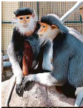
Languři v Zoo Chleby

Zoo Chleby poblíž Nymburka oslavila včera 25 let od za-